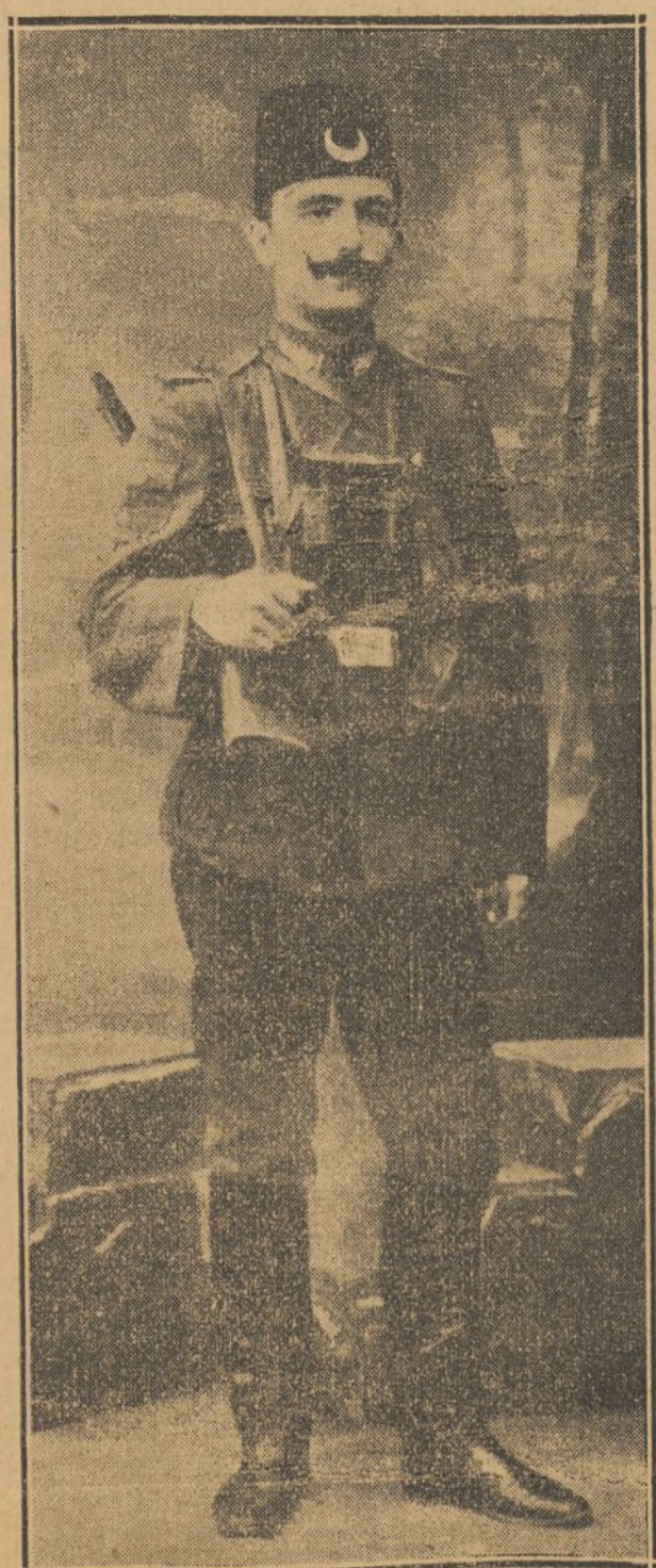
ENVER BEY director del movimiento revolucionario de Constantinopla