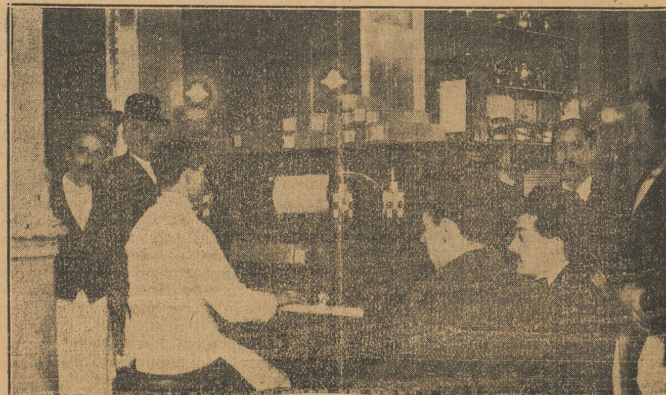
EL «PINCHE» TOCANDO ANTE UN GRUPO DE «DILETTANTI»