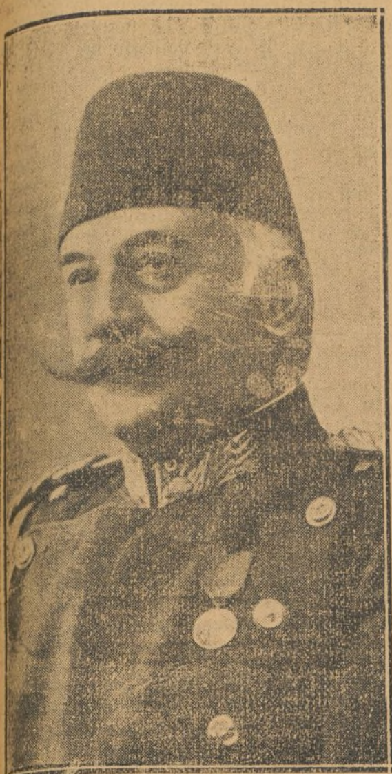
NAZIM PACHA recientemente asesinado