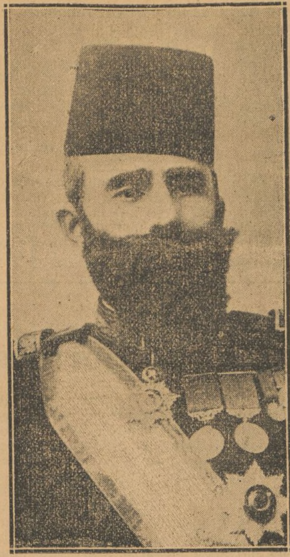
CHENKET PACHA nuevo gran visir