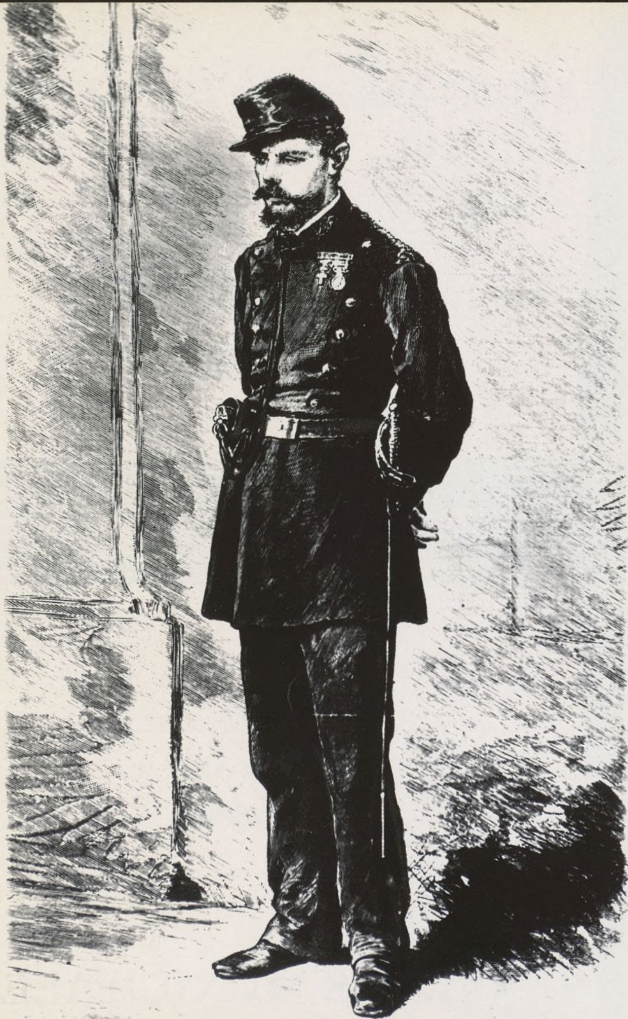
Madrid.—Un «guindilla» (Guardia Municipal) 1880.