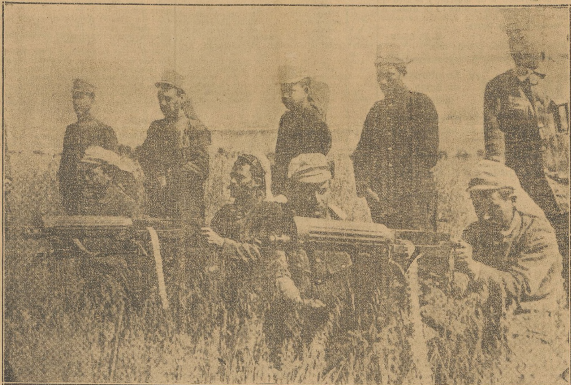
LOS GRIEGOS EMPLEANDO LAS NUEVAS AMETRALLADORAS CONTRA LOS TURCOS EN SARANTAPORON

todas las tonterías de la boca de grandes filósofos.