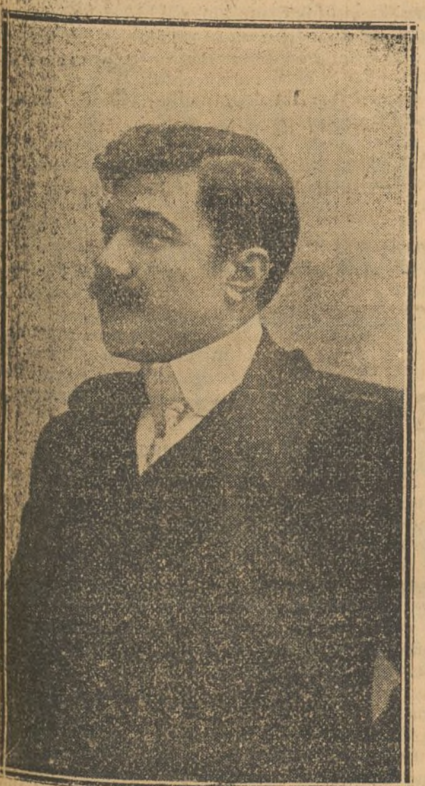
El tenor VIRAS

cederá el mando á quien logre arrancar su lanza.