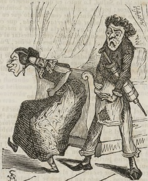
Contra el decir del doctor, la mujer de don Jesualdo