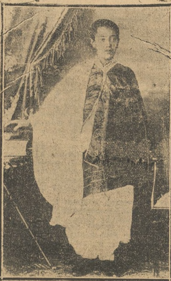
EL NUEVO EMPERADOR DE ABISINIA