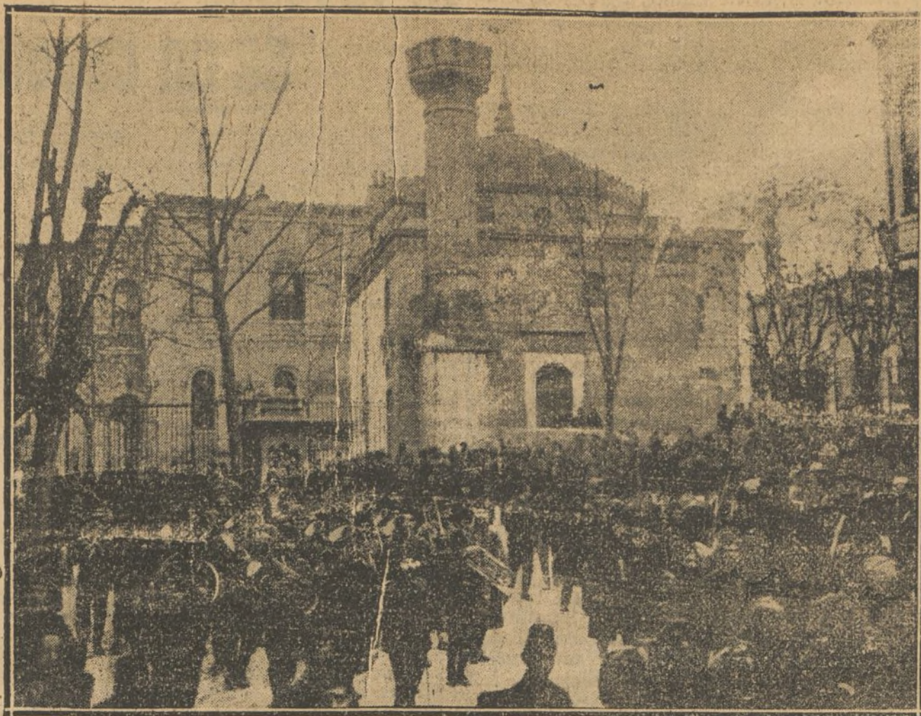
VOLUNTARIOS KURDES, QUE VAN A EMBARCARSE PARA SILVIRI