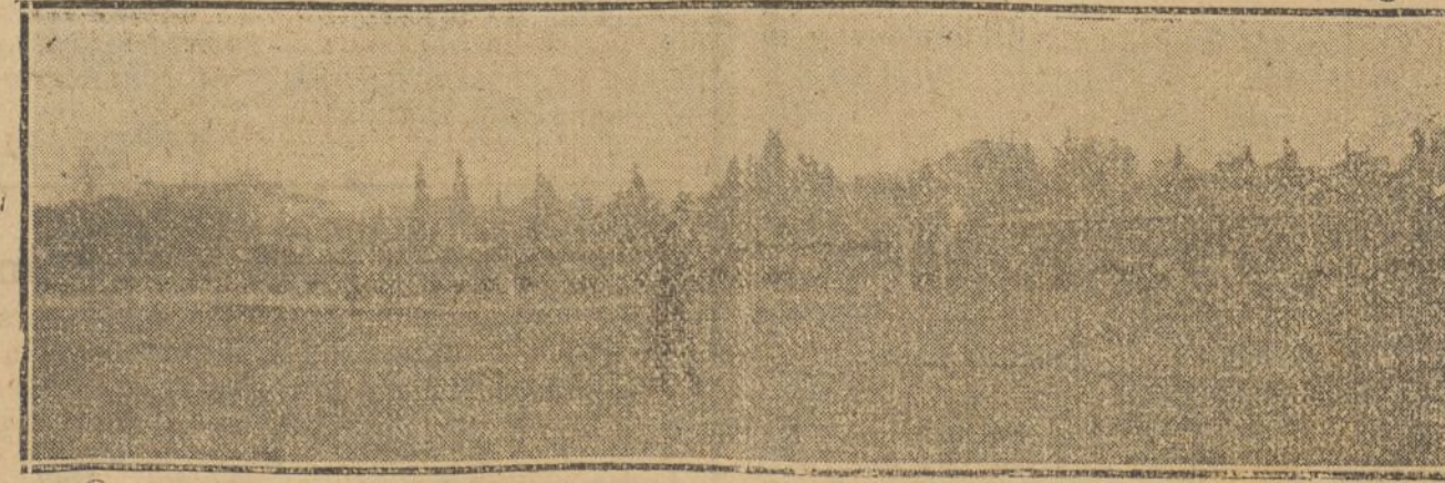
«PEPE-LAPIZ» EN BUSCA DE ORESTES

Entre protestas de los viajeros y voces des- templadas del cobrador, arranca el coche calle Mayor adelante, con el «completo» echa- do; pero de una de las aceras surge un ca- ballero de barba blanca, gabán con vueltas de astracán y chistera de ocho reflejos.