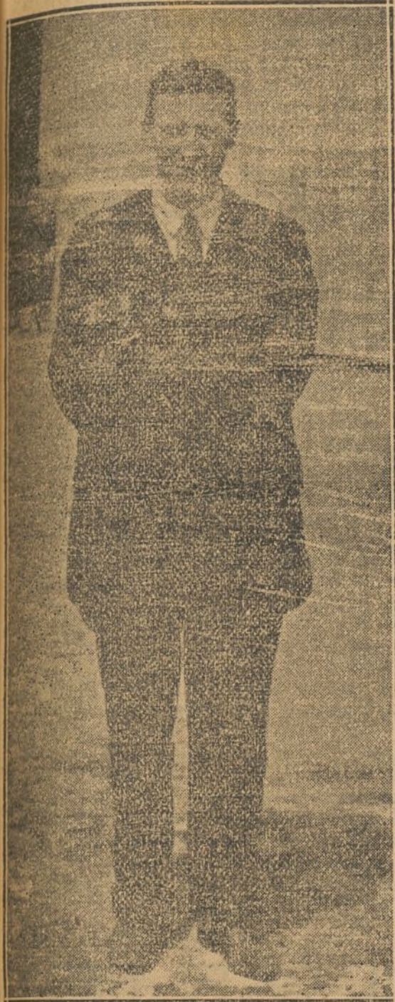
TRATO DEL AVIADOR BRINDEJONC, OBTENIDO EN CUATRO VIENTOS