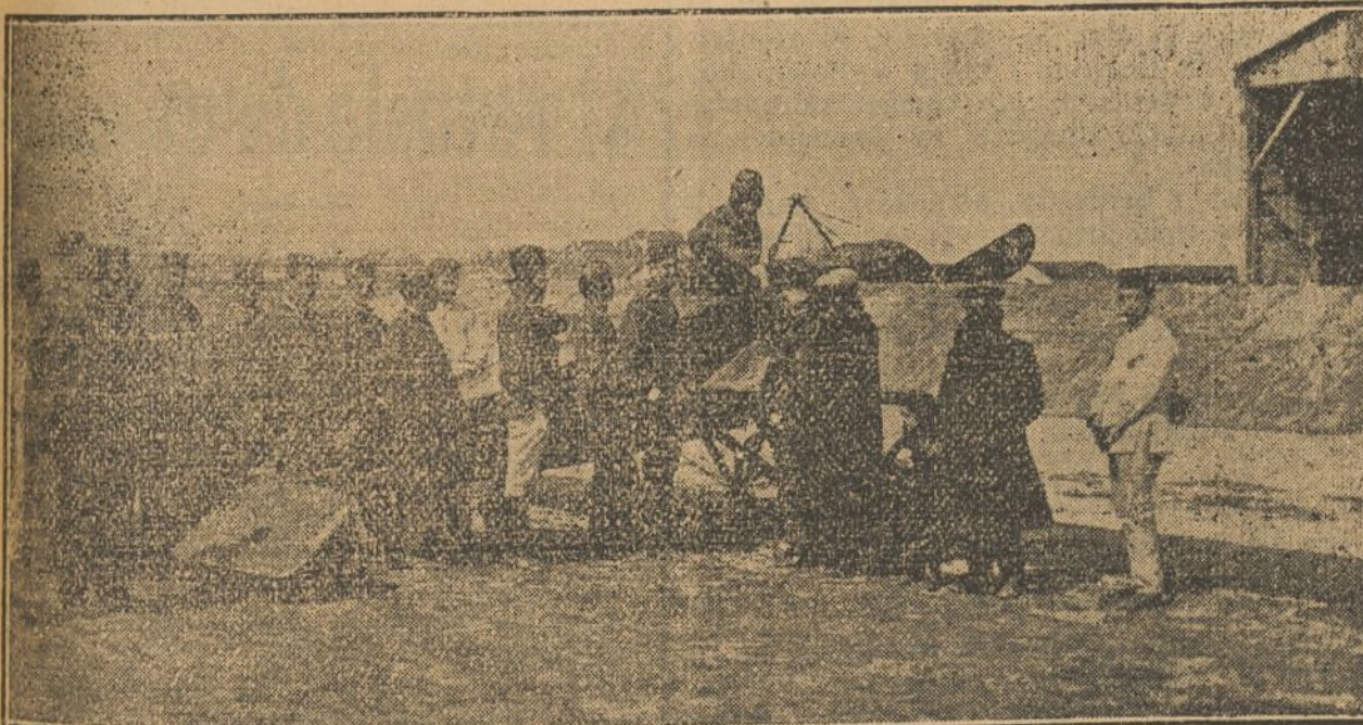
EL AVIADOR HABLANDO CON EL CORRESPONSAL DE «LE PETIT PARISIEN»