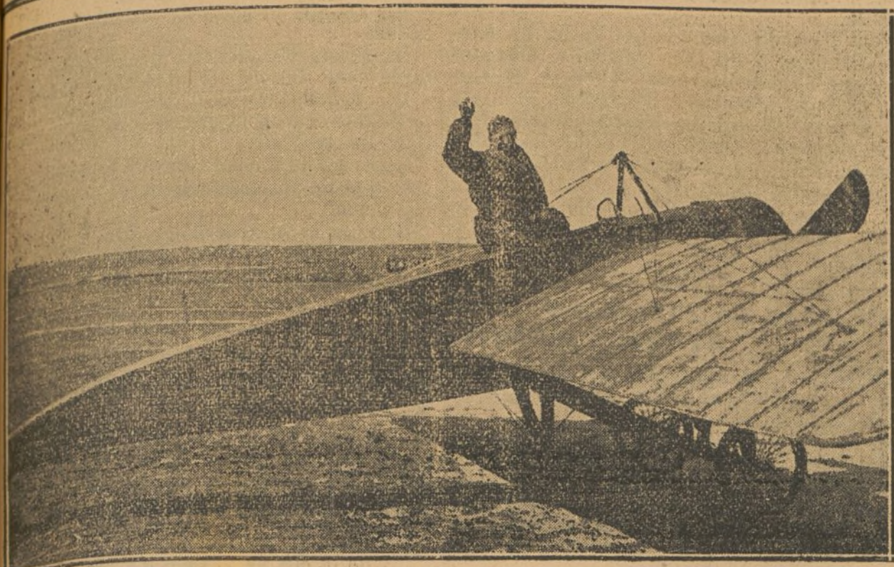
EL AVIADOR BRINDEJONC A SU LLEGADA A CUATRO VIENTOS