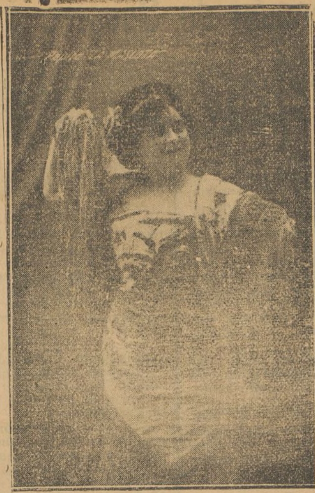
La Mascota, hermosa cupletista que actúa con éxito en el Eden-Concert

El ministro de la Gobernación, al recibir esta madrugada á los periodistas, les manifestó que las últimas noticias que tenía de Riotinto, eran inquietantes, pues el gobernador le comunicaba que no habían podido llegar á un acuerdo, y que aunque ponía todo lo que estaba de su parte para su solución, desconfiaba de corregirlo.