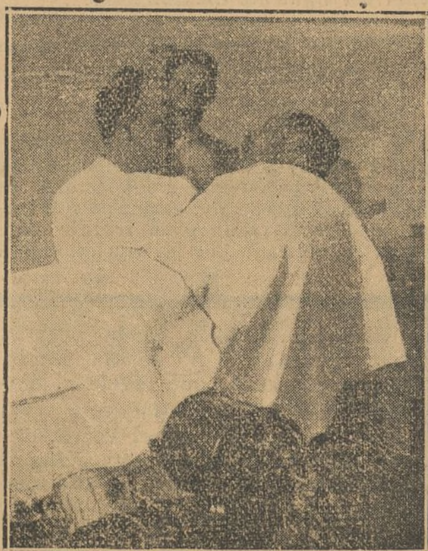
OPERANDO A UN ENFERMO

—El médico... La asignación para médicos, en casos de epidemia, es pobre, insuficiente... tiene que asistir a los tífos, y tiene que acudir a los demás enfermos del Hospital, y como el sueldo es mezquino, y con él no se puede atender a los gastos de su casa; el médico, tiene en Madrid una clientela, más ó menos numerosa, a la que tiene que asistir... Pues este médico, aunque sea muy escrupuloso, por mucho cuidado que quiera poner en su desinfección, siempre llevará un germen de contagio a sus enfermos, que prenda según la naturaleza de cada uno; en Inglaterra, Francia, Alemania, Bélgica, en cualquier nación medianamente próspera, cuando se inicia una epidemia, se nombran los médicos necesarios para la asistencia de atacados; se les aísla por completo, se les prohíbe, bajo penas severas, que asistan a nadie; pero, en cambio, se hace un cálculo aproximado de las pérdidas materiales que se les causan, y al final de epidemia se les indemniza prodigamente, además de premiar sus servicios con una concesión honorífica, y en caso de fallecimiento por contagio, la familia percibe una indemnización ó una pensión vitalicia.