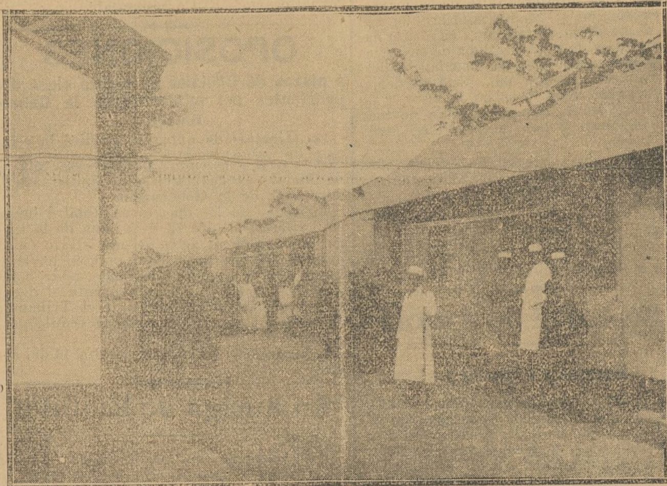
Lugar donde están instalados los pabellones para tíficos

...y como en el texto del mencionado ar-