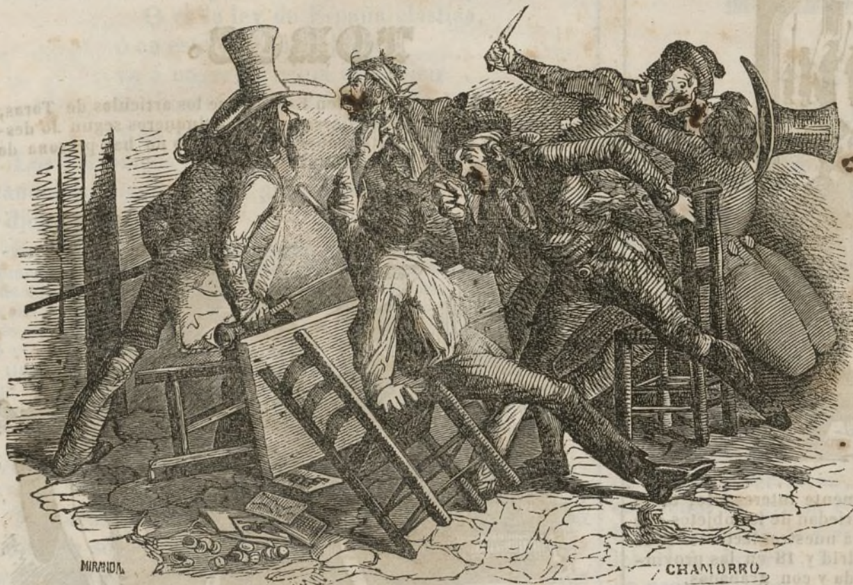
La vida del jugador.

El jugador inmoral medra á costa de los bobos; pero derrocha el caudal y las camorras y robos le preparan el dogal.