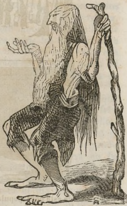
Las gracias de la vejez.

El holgazan que soez suele levantar el codo con el Málaga ó Jerez. ostentará de este modo las gracias de la vejez.