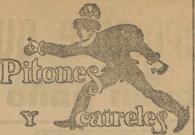
Pitones y cañales