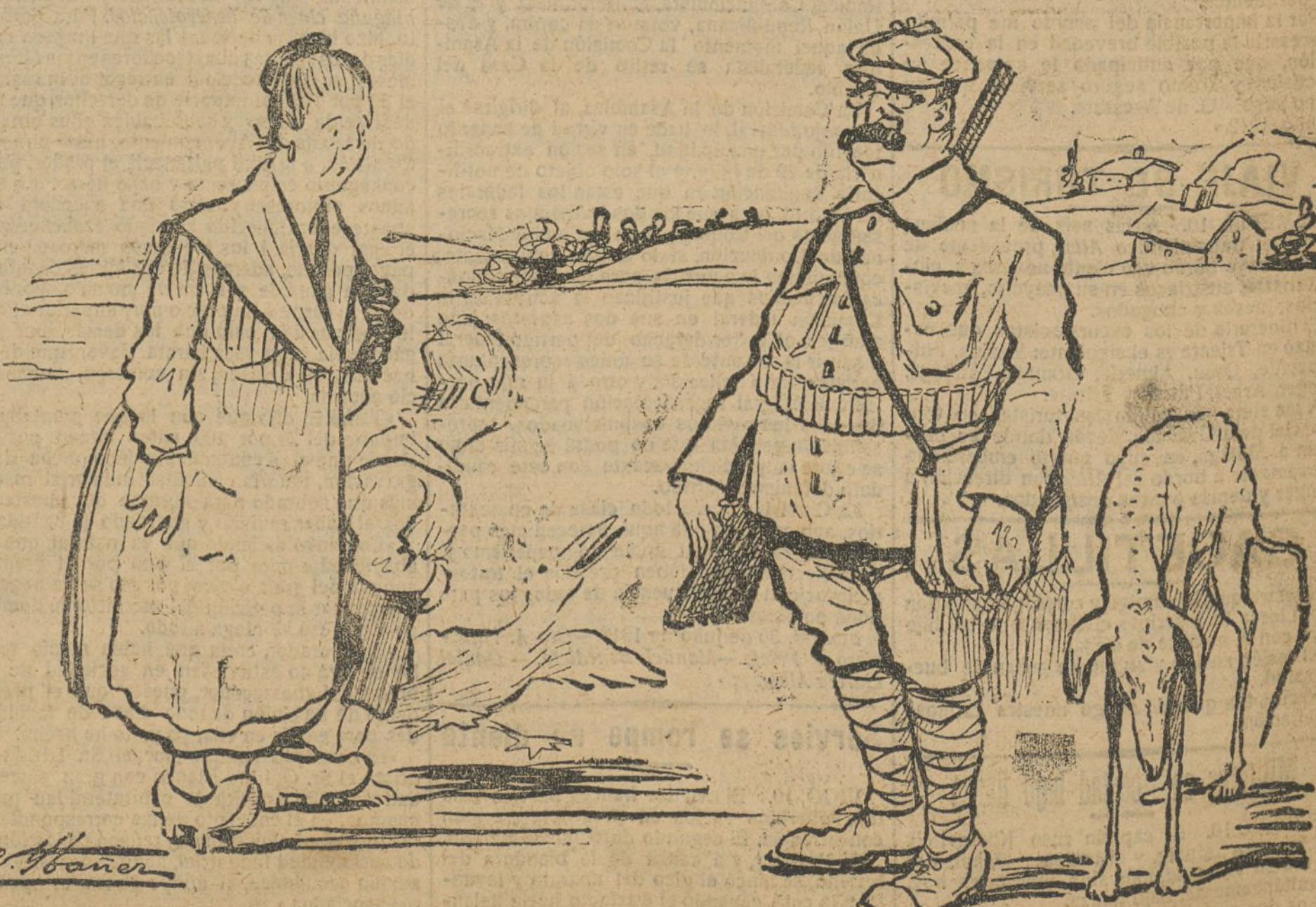
El presidente del Consejo siempre de caza, de aquí para allá.