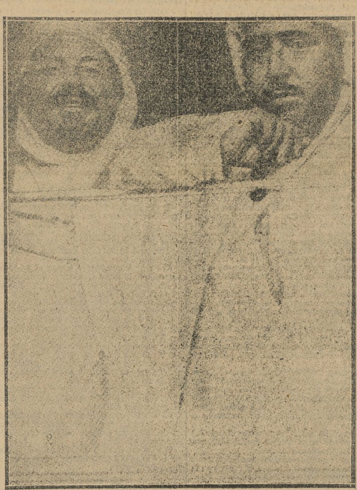
El ex sultán Muley Hafid a su llegada a Vichy.