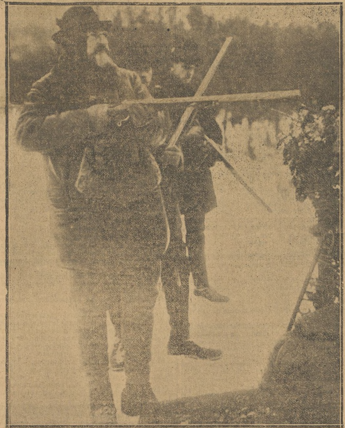
EL REY FERNANDO DE BULGARIA CAZANDO EN SU FINCA DE BALOGRAR, EN HUNGRIA