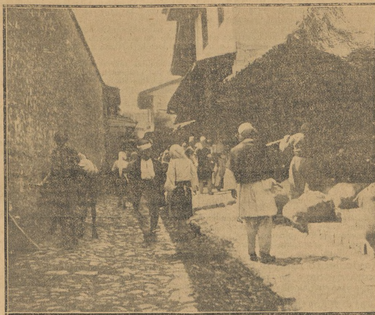
ALDEANOS TURCOS ABANDONANDO LA FRONTERA DESPUES DE ROTAS LAS HOSTILIDADES

Llegada del Sr. Lerroux BARCELONA 18 (1 mañana). Con objeto de tomar parte en los actos anunciados, el Sr. Lerroux, jefe del partido radical, llegó a esta mañana.