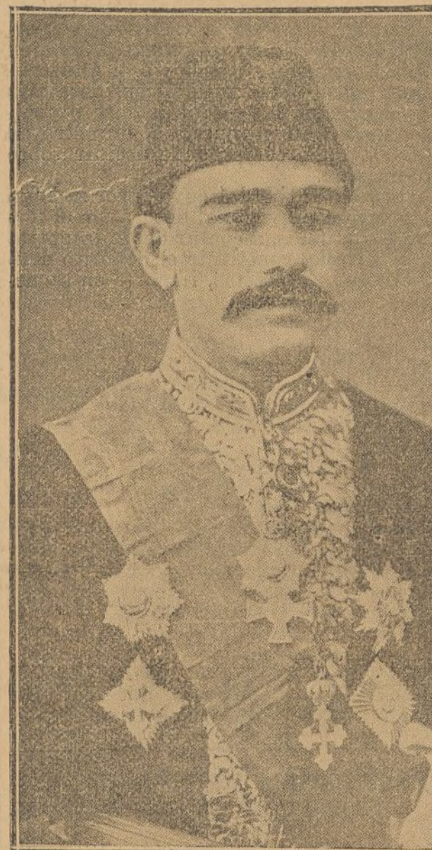
ESSAD PACHA, GENERAL TURCO ENCARGADO DE LA DEFENSA DE SCUTARI CONTRA LOS MONTENEGRINOS

RABAT, 20. La columna Gaudon, en los combates de los días 14, 15 y 16 del corriente mes, causó grandes pérdidas á los habitantes de Dadia, calculándose que alcanzan á mil las bajas que éstos han experimentado.