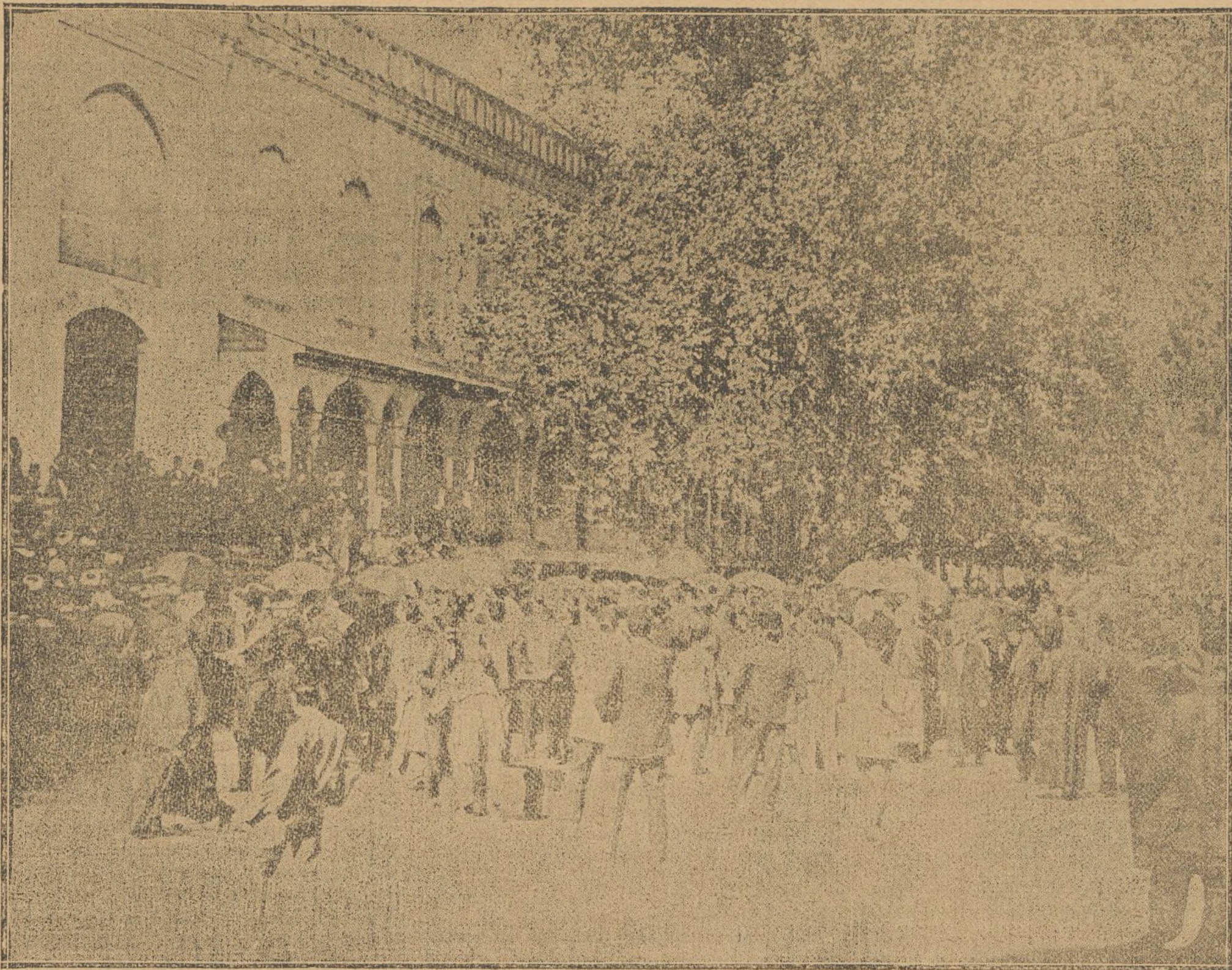
LA MULTITUD TURCA AGOLPADA ANTE EL MINISTERIO DE LA GUERRA, ESPERANDO LAS NOTICIAS DE LOS COMBATES