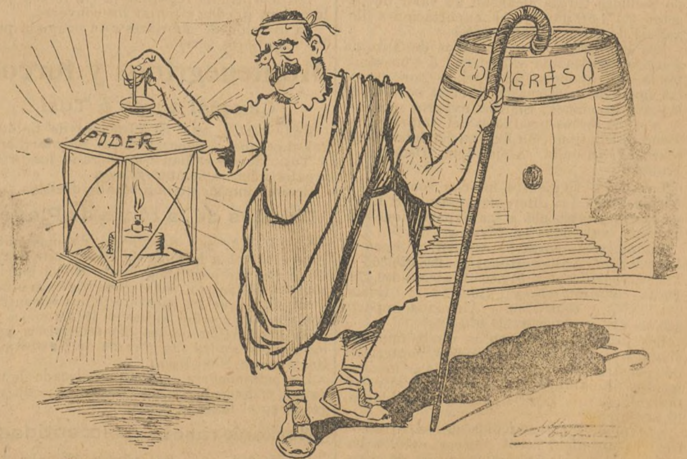
En cuanto se pone el sol—sale el hombre del tonel y no halla, ni con farol,—un diputado español que vote lo que dice él.