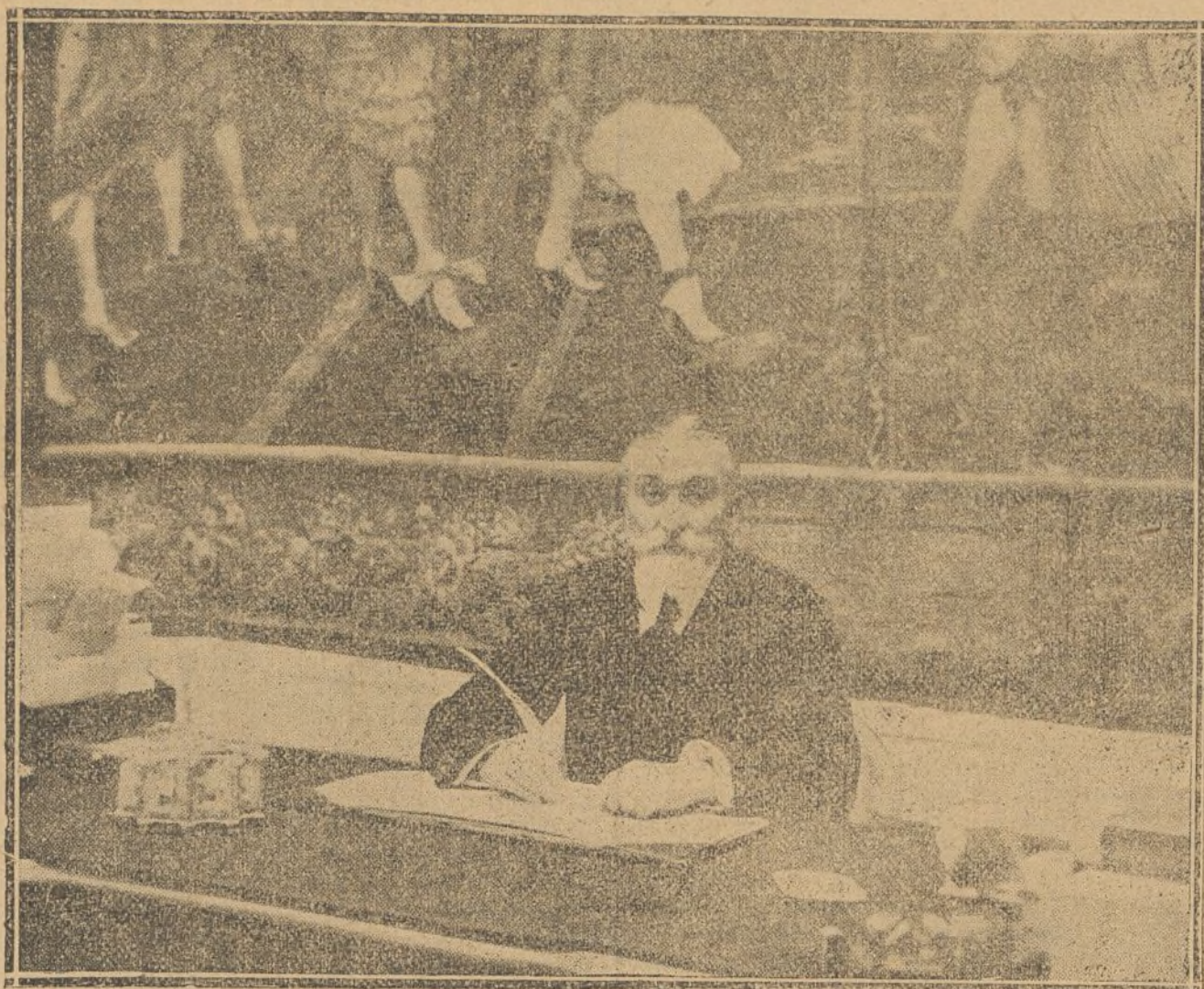
EL EMBAJADOR FRANCES, M. GEOFFRAY, ULTIMANDO EN SU DESPACHO EL TRATADO SOBRE MARRUECOS, QUE ACABA DE PACTARSE ENTRE ESPAÑA Y FRANCIA