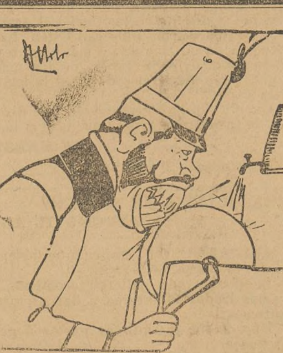
Austria se prepara á meter el diente en los Balcanes.