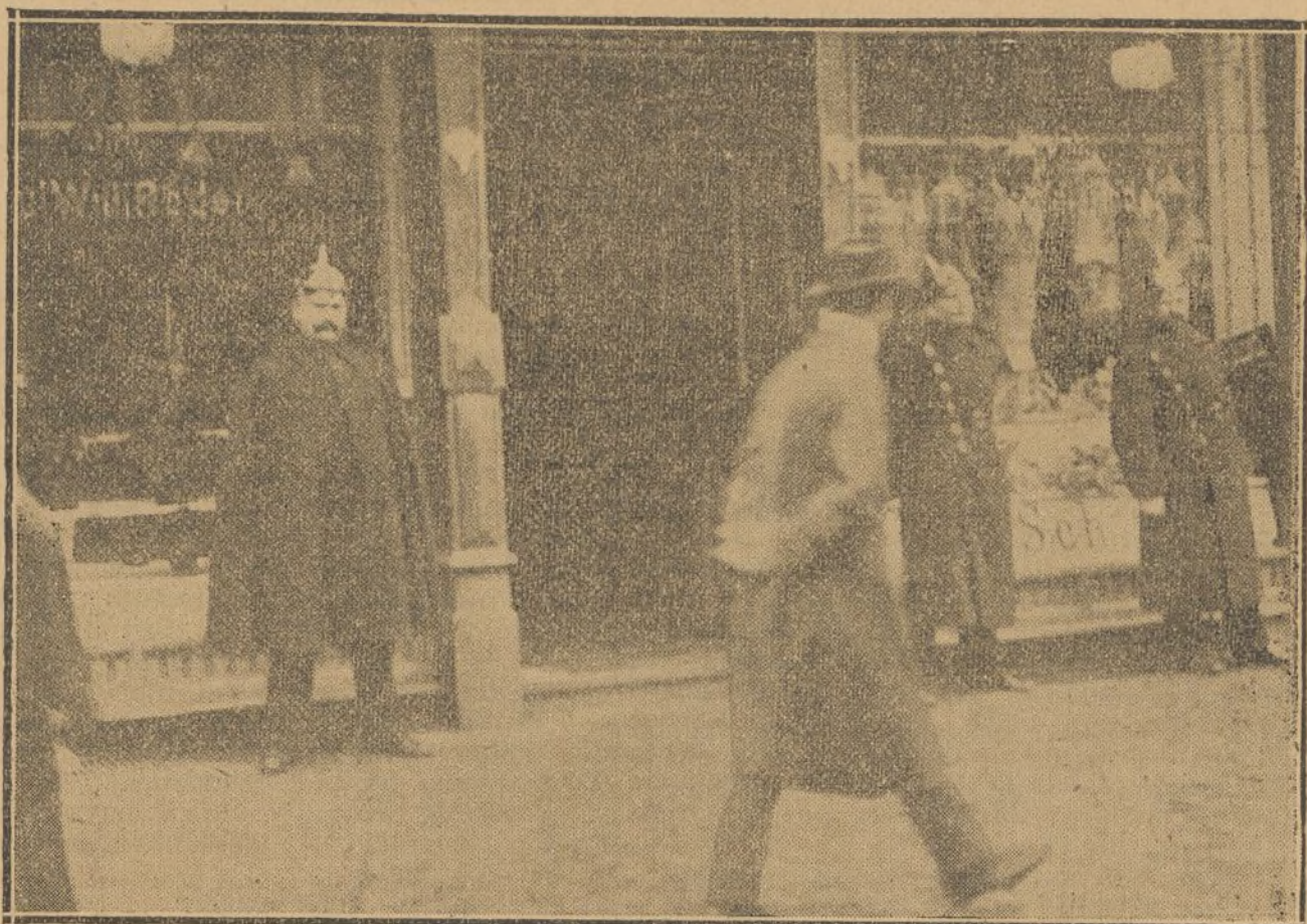
A CAUSA DE LA IMPORTACION DE LA CARNE RUSA, LAS CARNICERIAS FUERON ASALTADAS. HE AQUI UNA, CUSTODIADA POR LA POLICIA

preocupa que los eslavos constituyan en sus fronteras un imperio eslavo poderoso, y ésta, porque el fracaso de Turquía causará el desprestigio de su organización militar.