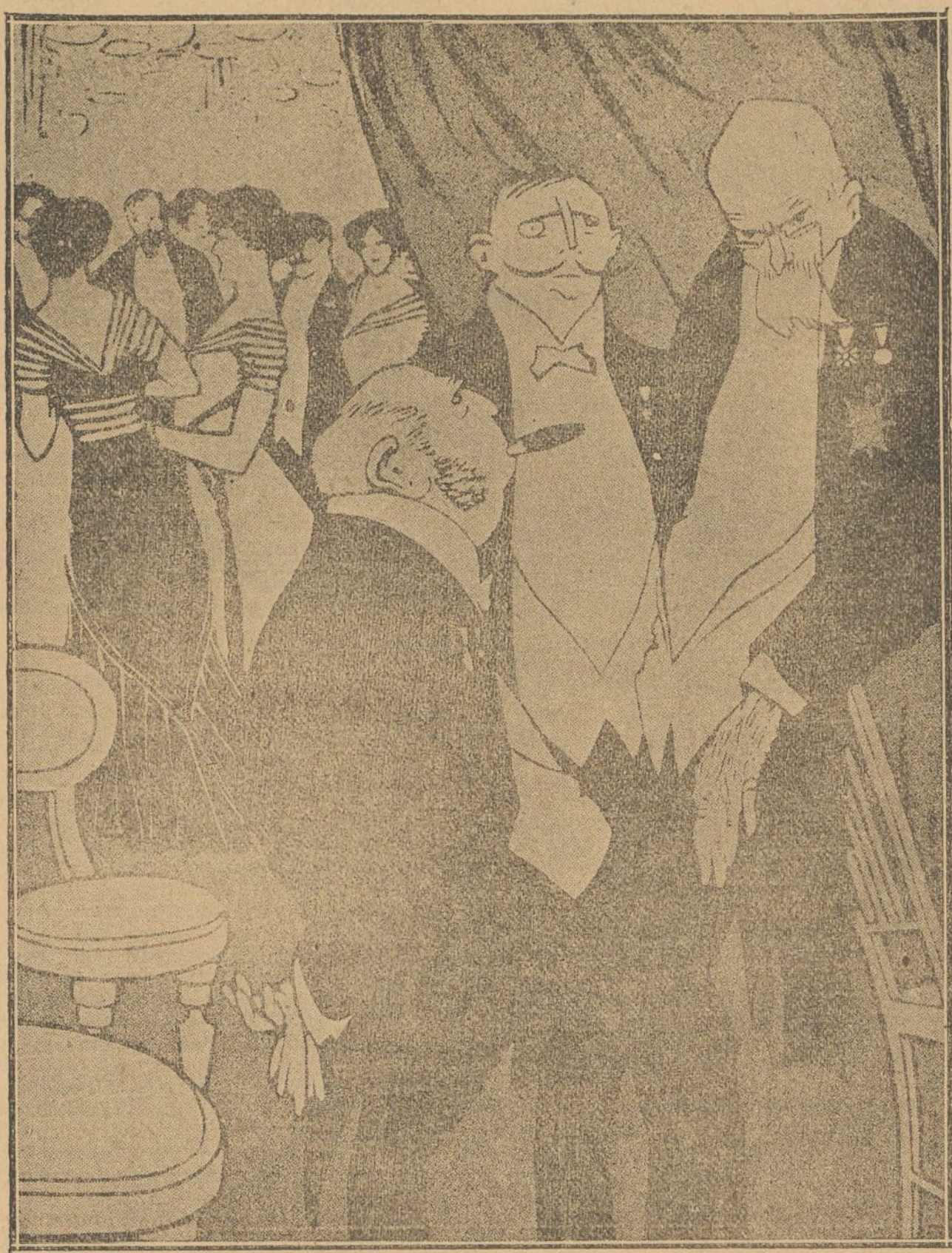
LOS DIPLOMATICOS.—NOSOTROS RESPETAREMOS LA INTEGRIDAD DE TURQUIA HASTA QUE SE DECIDA DARNOS UN PEDAZO...

quista toca á su fin en toda España; esa dominación será sustituida por la de unas autoridades sociales, que conviertan en amor el terror que han generado los caciques.