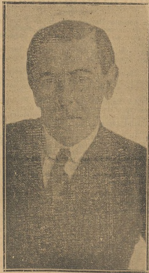
MISTER WILSON candidato triunfante