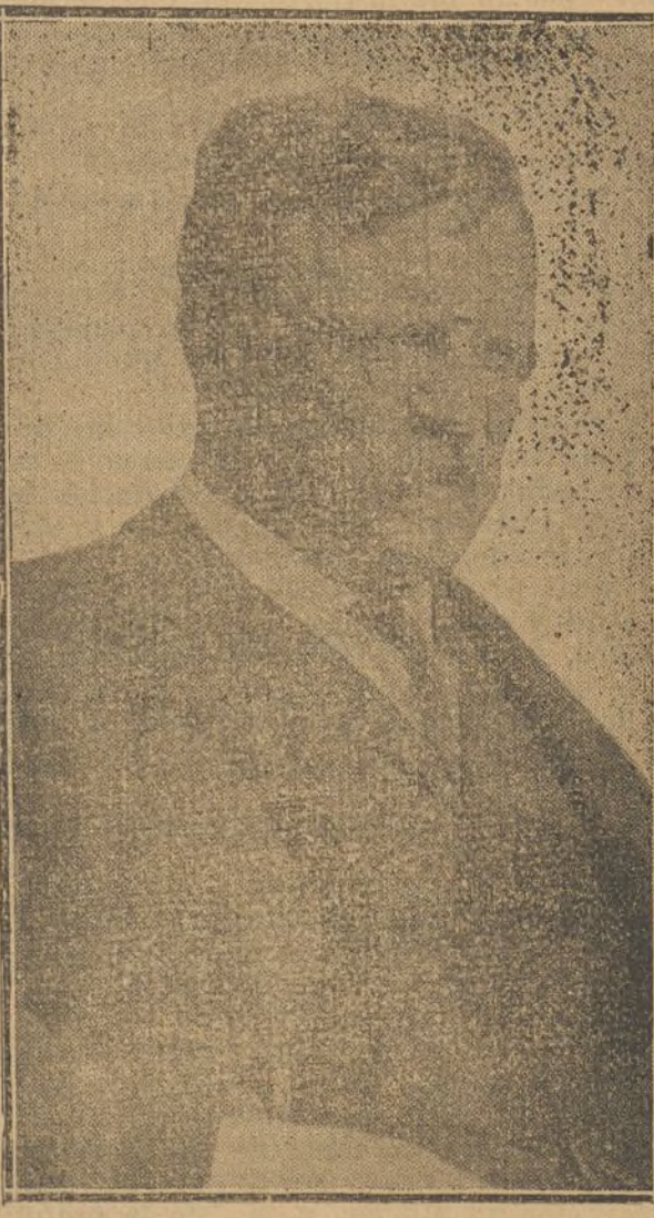
MISTER ROOSEVELT candidato derrotado