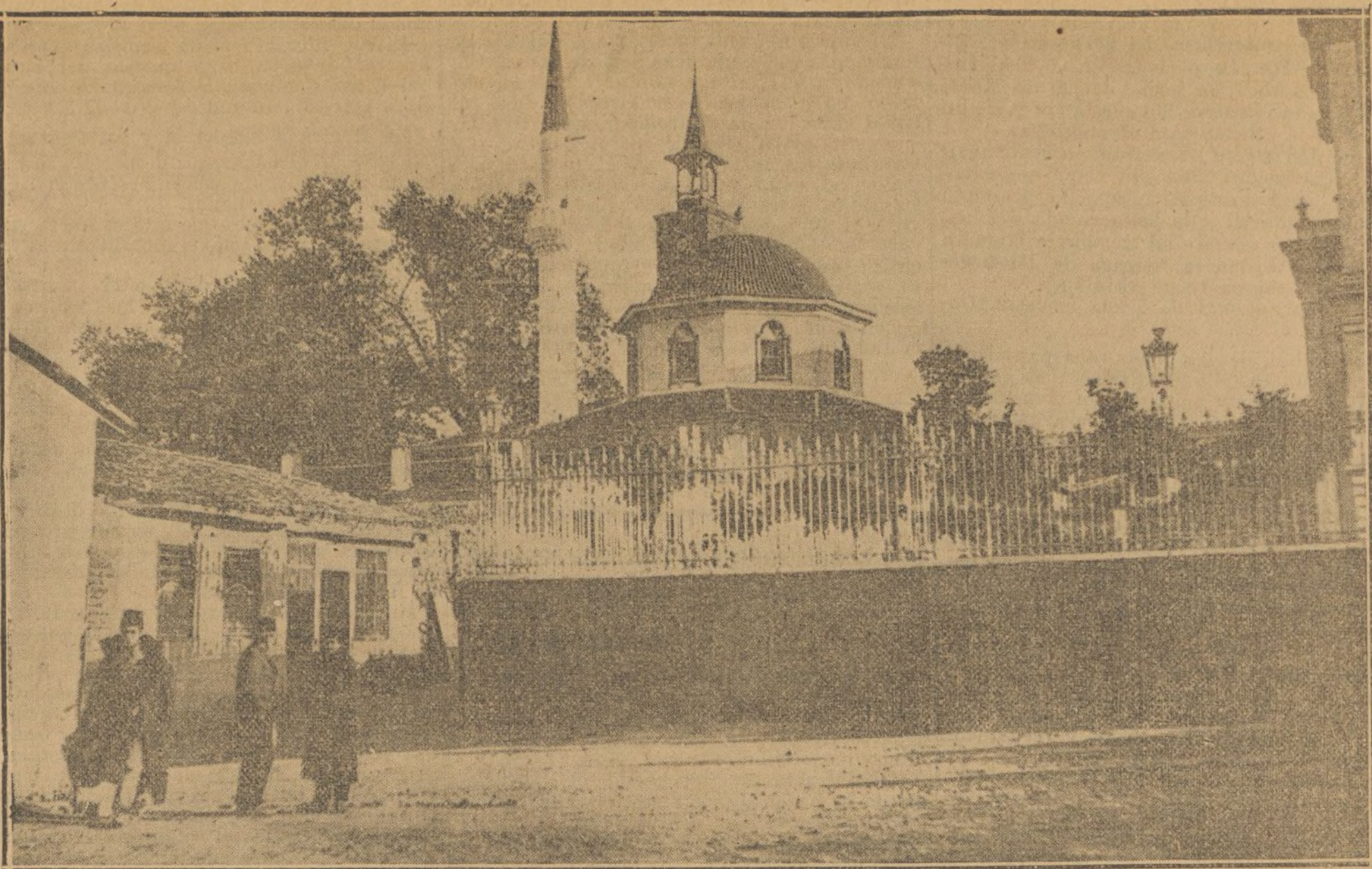
LA MEZQUITA DE SATILI DJAMI, EN SALONICA, CIUDAD QUE ACABA DE CAER EN PODER DE LOS GRIEGOS