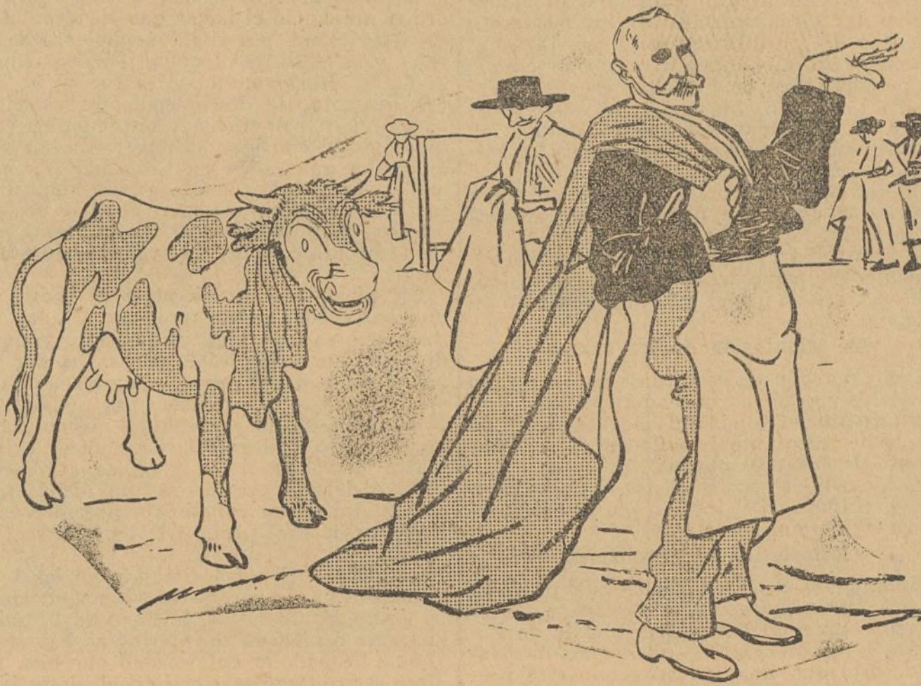
Uno que se está "entrenando" para la próxima temporada