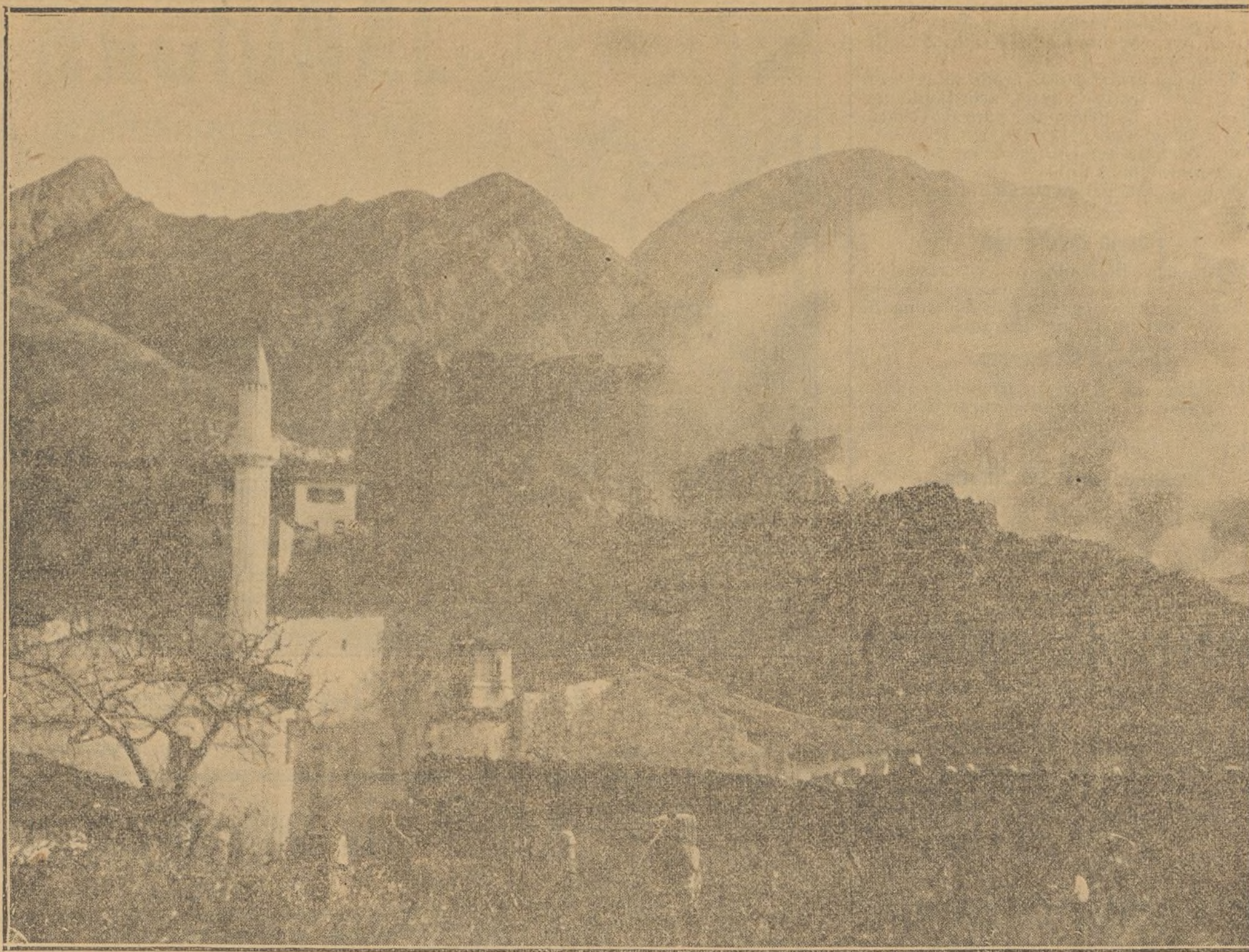
EXPLOSION DE UN POLVORIN EN ANTIVARI, EN LA QUE DOS MUJERES DE LA CRUZ ROJA DEMOSTRABAN GRAN ARROJO SALVANDO A DOS SOLDADOS HERIDOS DENTRO DEL POLVORIN