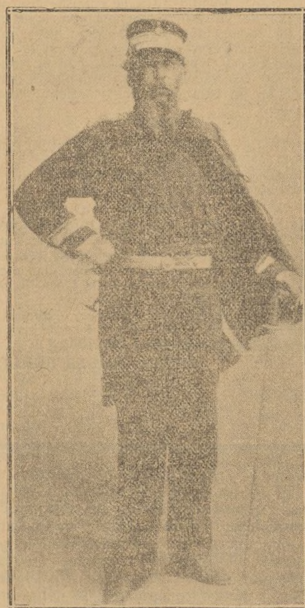
GENERAL RICCIOTTI GARIBOLDI, hijo del célebre patriota italiano, que ha organizado un Cuerpo de voluntarios italianos para combatir al lado de los griegos

los marinos desembarcados de los buques de guerra.