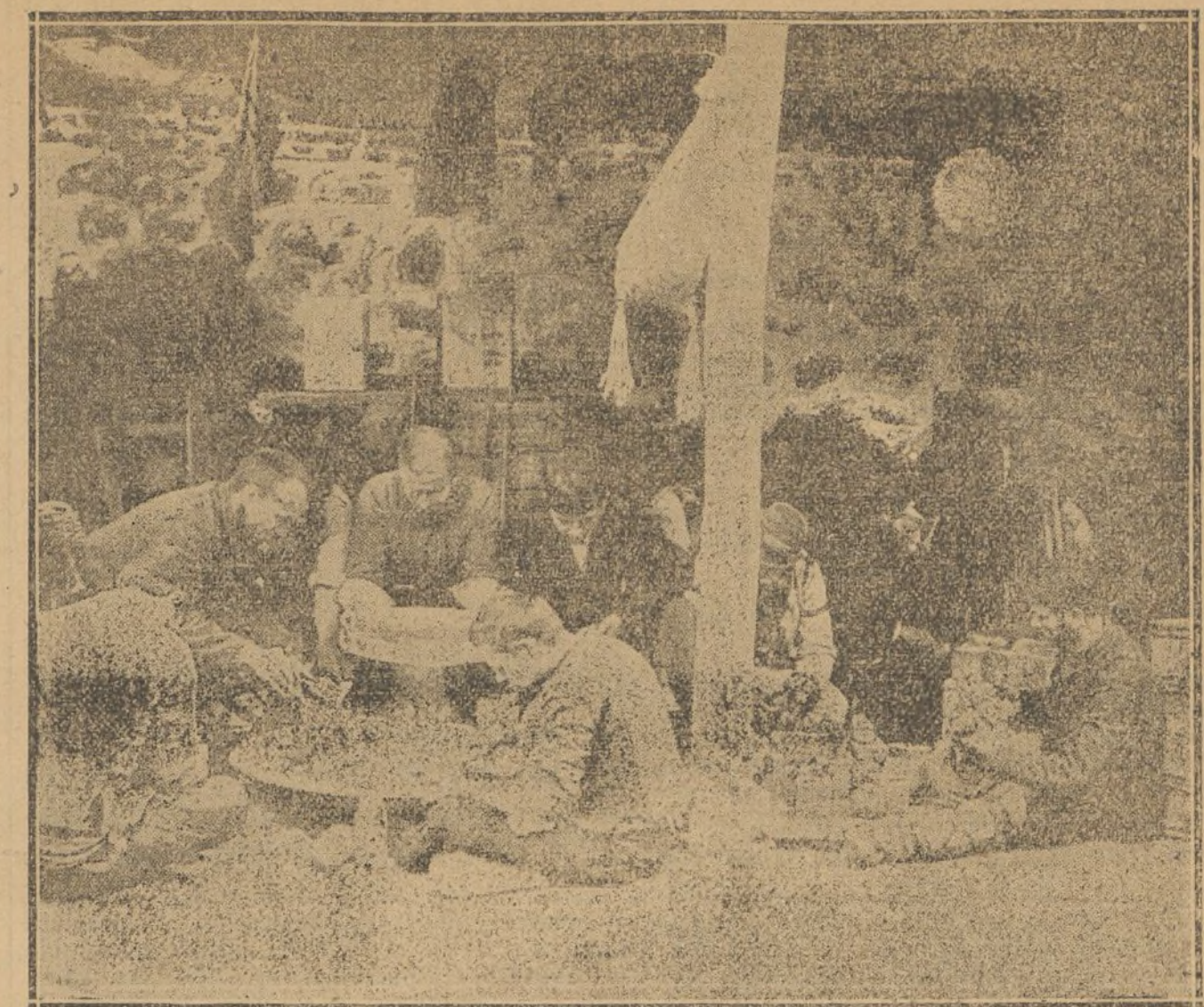
UN TALLER DE FABRICACION DE BOMBAS DE MANO POR LOS SOLDADOS MONTENEGROS