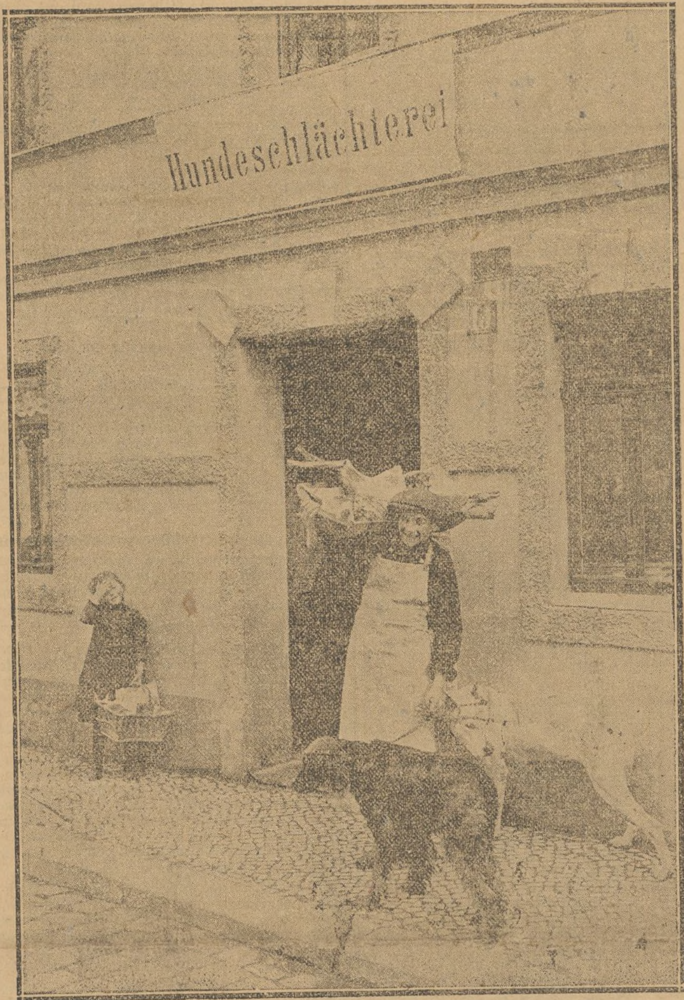
EFFECTOS DE LA CARESTIA DE CARNES EN ALEMANIA, DONDE LA CARNE DE PERRO HA SUSTITUIDO A LA DE VACA, CARNERO Y CERDO. — NUESTRA FOTOGRAFIA REPRESENTA LA TIENDA DE UNO DE LOS PRIMEROS CARNICEROS DE HALLE QUE DESPACHARON LA CARNE DE PERRO, APROVECHANDO EL HAMBRE