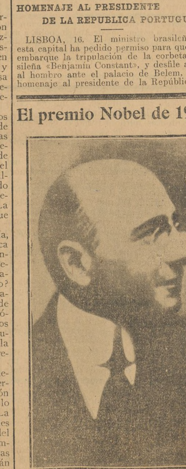
EL DOCTOR CARREL, DEL INSTITUTO ROCKEFELLER, DE NEW-YORK