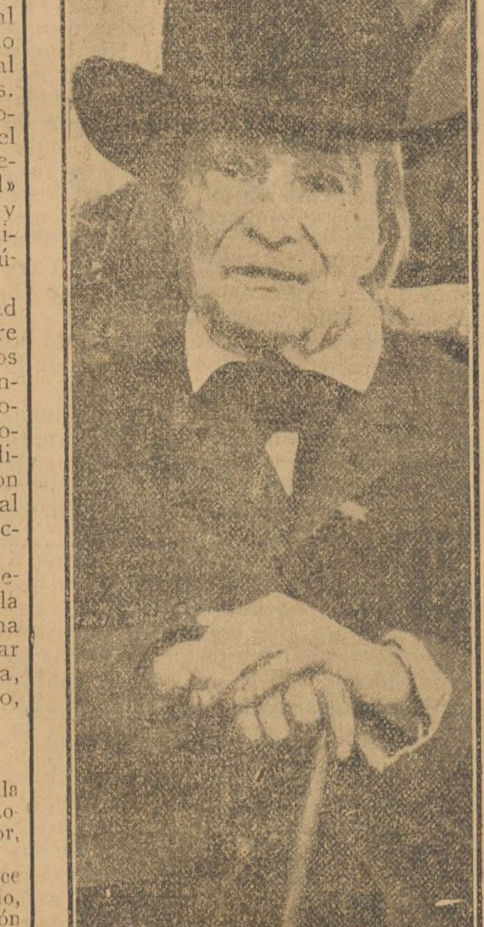
EL NATURALISTA FRANCIS J. H. FABRE