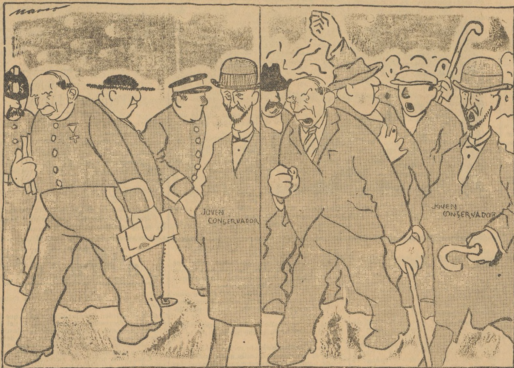
Antes de la manifestación