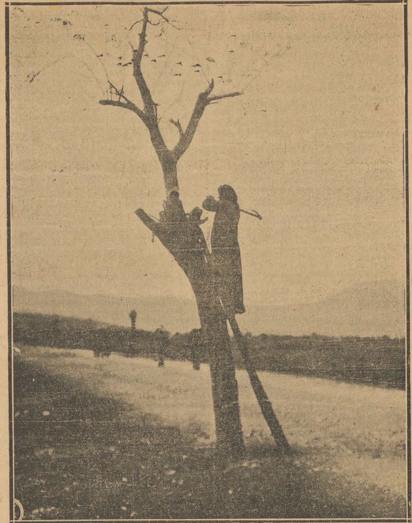
UNA MUJER MONTENEGRINA CORTANDO LEÑA PARA LLEVARLA A LOS CAMPAMENTOS, EN LAS CERCANIAS DE PODGORITZA