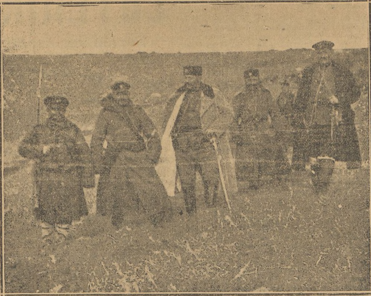
EL GENERAL JEFE DE LA ARTILLERIA BULGARA RECORRIENDO LOS ALREDEDORES DE LA CIUDAD PARA RECTIFICAR LOS TIROS DE LA ARTILLERIA