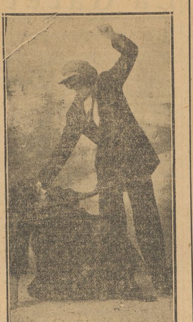
LAS OROPESAS eminente y aplaudida pareja de «varietés» que actúa con gran éxito en Almería