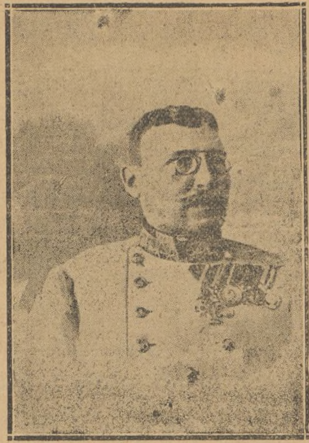
GENERAL AUFFENBERG ministro de la Guerra dimisionario