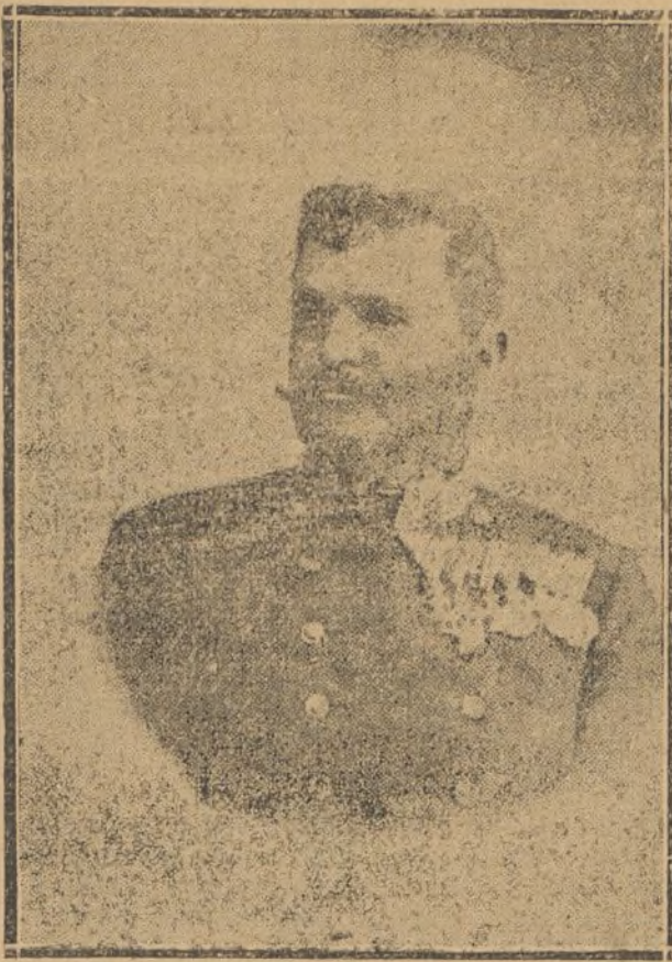
GENERAL BLASIEUS SCHEMUA jefe del Estado Mayor General, dimisionario

SEVILLA, 17. En breve llegará el presidente de la Juventud liberal de Barcelona, con varios socios de la misma y otros de Madrid, para asistir al mitin proyectado por as Juventudes monárquicas.