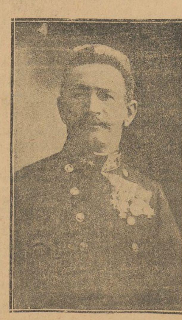
EL GENERAL HATZENDORF nuevo jefe del Estado Mayor General