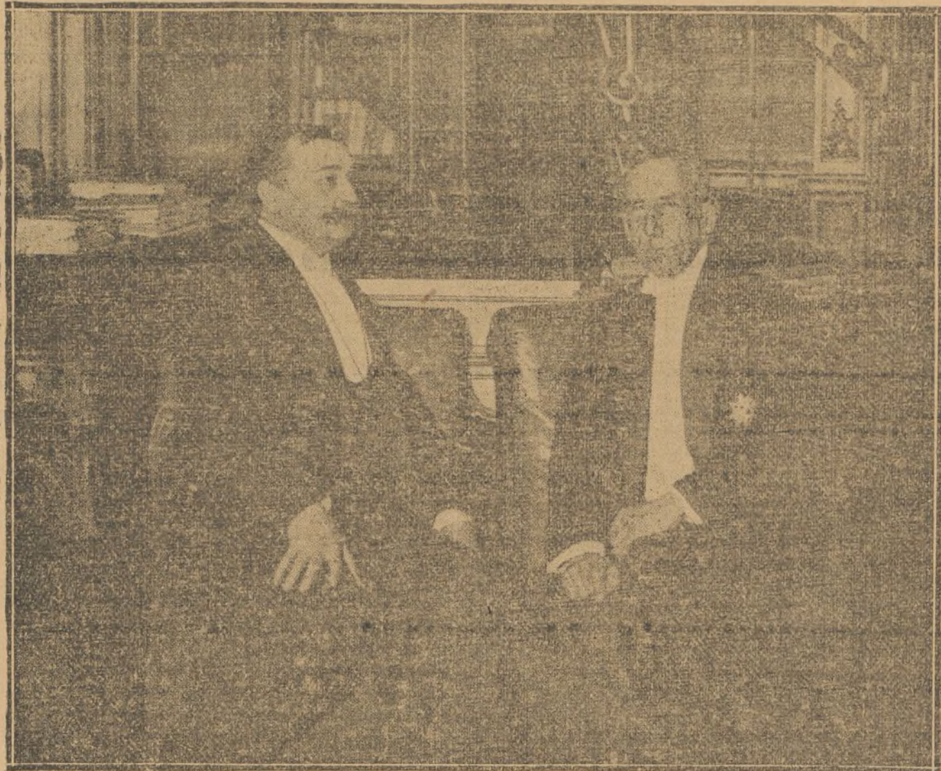
EL EXPLORADOR AMUNDSEN EN CASA DEL PRINCE ROLAND BONAPARTE

diario integrista, es peregrina. Redimirse es acabar con los republicanos y socialistas y sindicalistas. Redimirse, es «arrojar al fuego la Constitución» y hacer otra de acuerdo... con el Papa. Redimirse es estatuir que delinque el pensamiento; que el derecho público sea católico, que se pongan en el régimen á los intereses de la Iglesia romana. Y además que se subvencione oficialmente á «El Siglo Futuro».