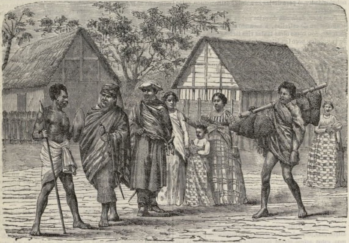
Trajes y habitaciones de losdahomeys.

En la travesia desde España á Fernando Póo, se encuentran en el golfo de Benin buques ingleses y franceses, que