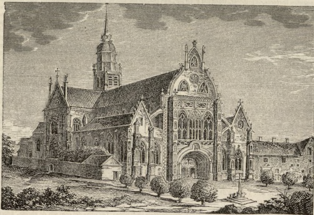
Iglesia de Brou, en Bourg.

título cualquiera que fueran las obligaciones que nos imponía. Con la variedad y el interés universal de nuestros asuntos hemos realmente formado un Museo de las Familias . Tal es la ventaja de nuestro plan que frecuentemente los artículos más desemejantes son los más interesantes y forman más contraste, lo que despierta en el espíritu de nuestros