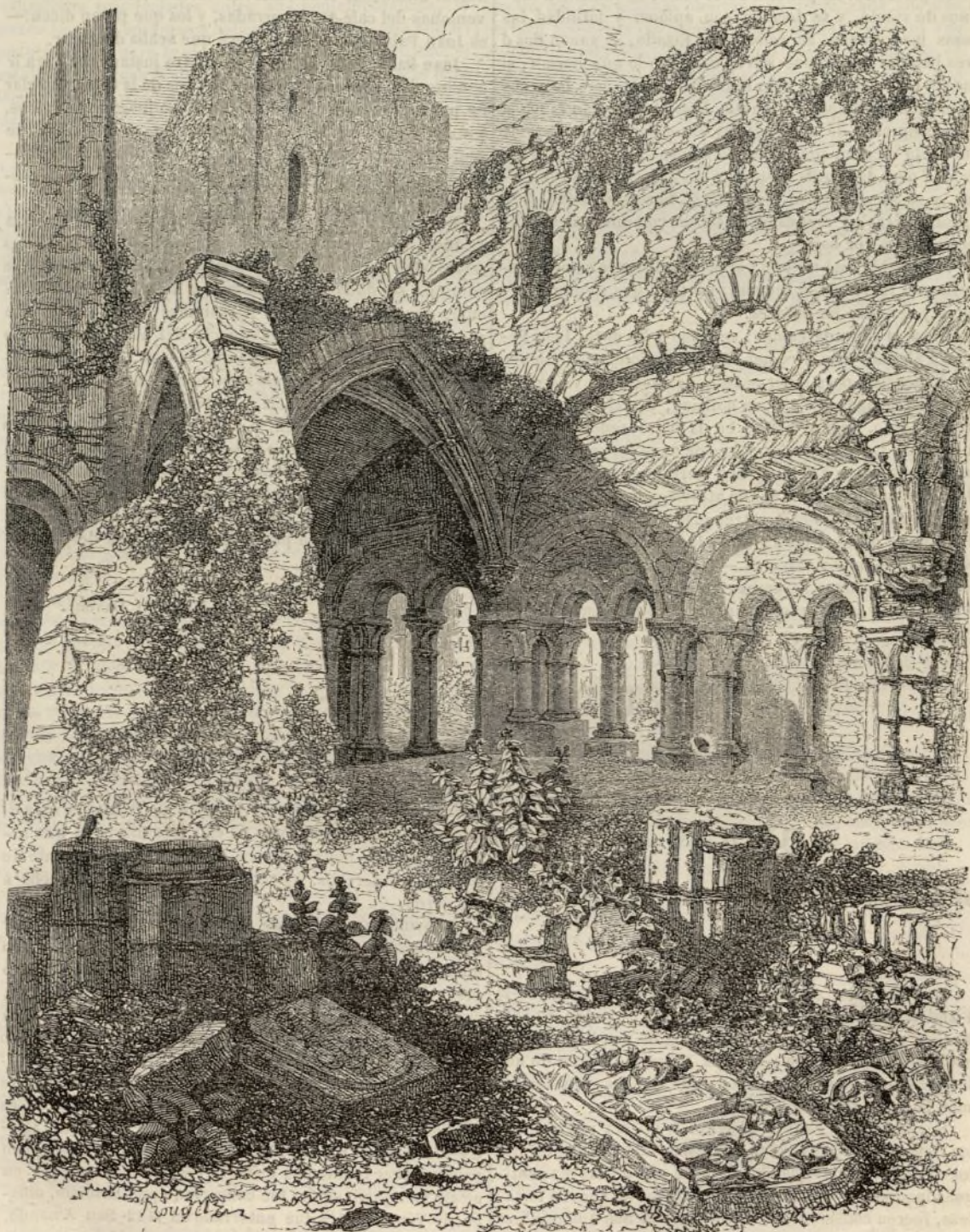
Ruinas de la abadía de San Bavon y cripto de Santa Maria, en Gante.