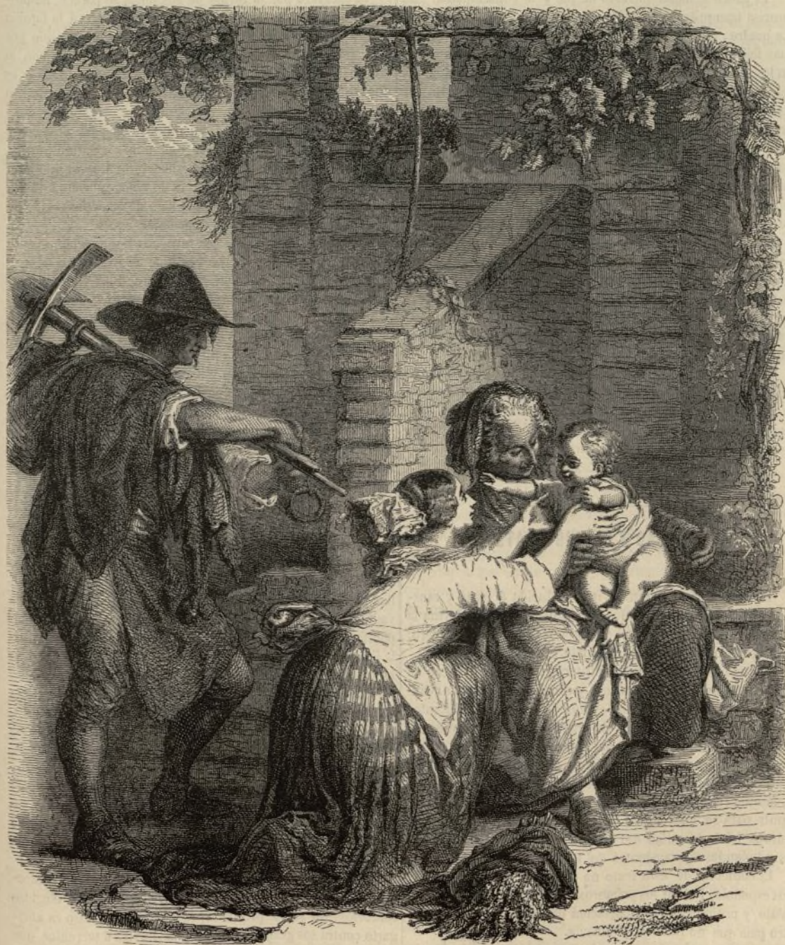
La vuelta del trabajador.—Cuadro de A. Van-Muyden.

De vuelta, volví á pasar cerca de la casa, y ya me disponía á dar amistosamente unas buenas tardes á la anciana, cuando una jóven aldeana y su marido, que venían por el otro lado, llamaron mi atención. Eran el padre y la madre del chiquitin. La jóven corrió, puso en el suelo el haz de yerbas que llevaba, y se arrodilló alargándole los brazos.