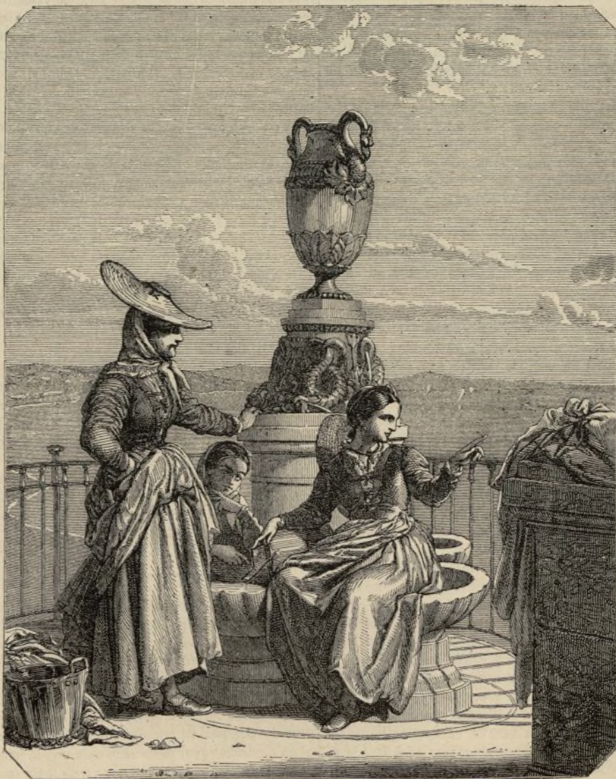
Una fuente sobre el muelle del Mediodia en Niza.

Con relacion á la belleza del paisaje no hay menos division en los pareceres y gustos. Para las personas habituales á buscar en la geología las formas de la naturaleza, es fácil de definir la diferencia: los alrededores de Cannes son graníticos; los de Niza son calcáreos. Síguese de aqui que Niza está rodeada de montañas blanquizcas, secas y desnudas en toda su region superior. El monte Calvo , cuya masa domina todas las demas alturas y cubre el fondo del cuadro,