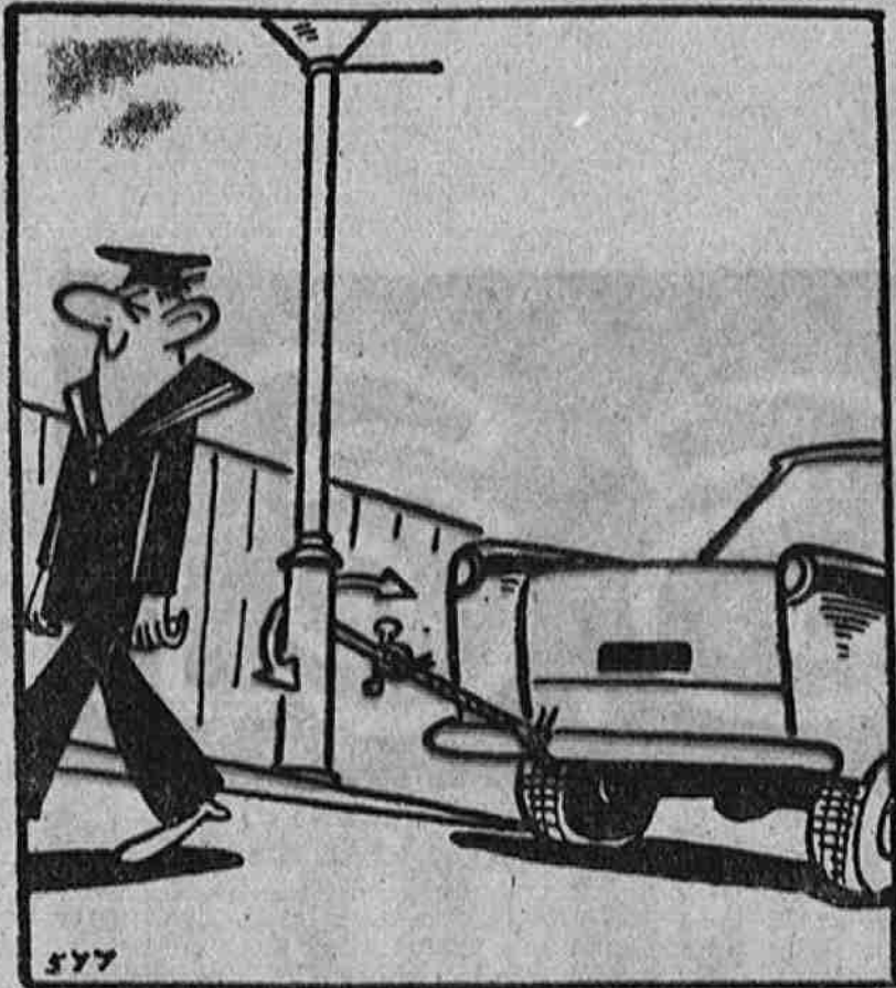
PARA SU COCHE

Encargue sus tulipanes antes de que llegue el momento de plantar las flores. Deben plantarse a diez centímetros de profundidad y con una separación de siete centímetros entre sí, pero no deben plantarse en tierra demasiado nitrogenada ni utilizar estiércol.