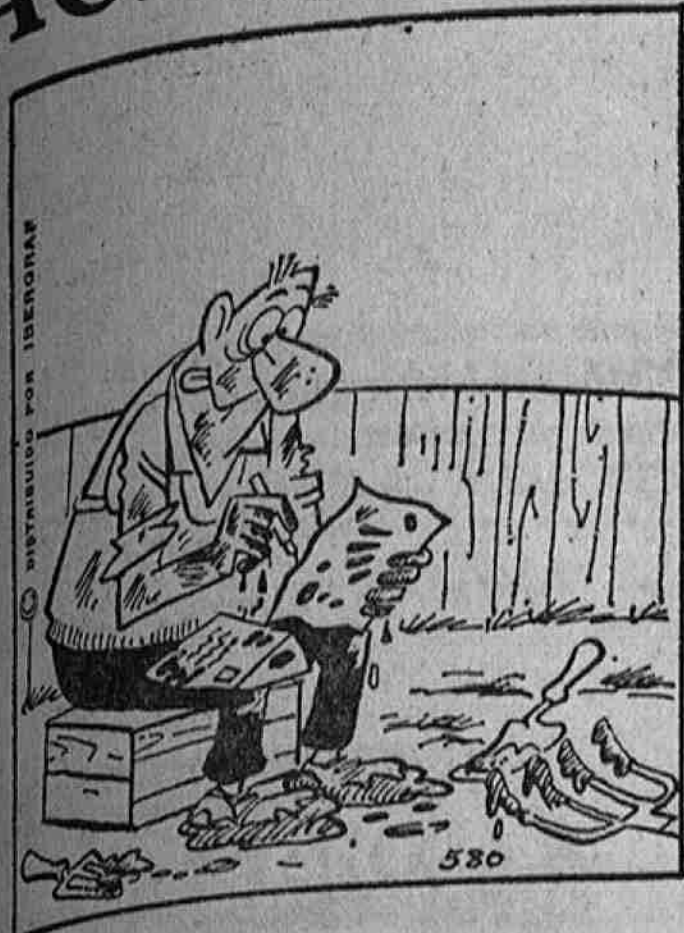
PARA SU JARDIN

Encargue sus tulipanes antes de que llegue el momento de plantar las flores. Deben plantarse a diez centímetros de profundidad y con una separación de siete centímetros entre sí, pero no deben plantarse en tierra demasiado nitrogenada ni utilizar estiércol.