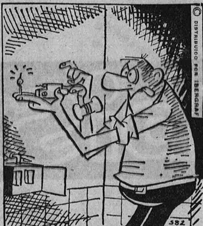
PARA SU CASA

Nunca se tiene demasiada precaución al aparcar en pendientes demasiado pronunciadas. No confíe en el freno de mano solamente, sino que deje el coche con la velocidad puesta. Otra medida de seguridad es la de doblar las ruedas contra la acera, de forma que actúen como bloqueo.