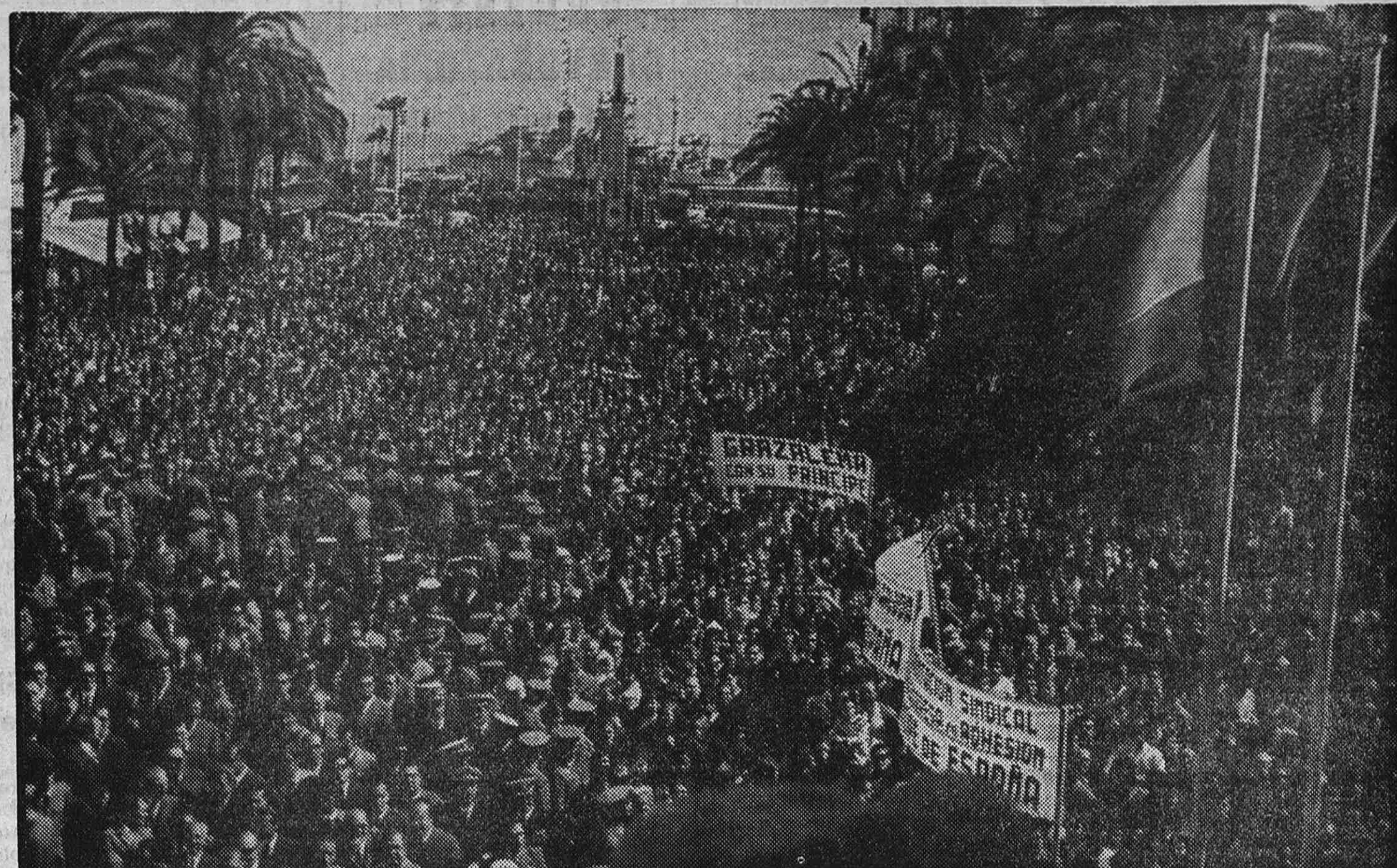
● Un aspecto de la plaza de San Juan de Dios, en Cádiz, repleta de gentes de toda la provincia para tributar un caluroso recibimiento a los Príncipes a su llegada al Ayuntamiento.

Hoy, en la última jornada de su estancia en las provincias de Sevilla y Cádiz, los Príncipes visitarán Jerez de la Frontera y, a última hora de la tarde, regresarán a Madrid desde la base naval de Rota.