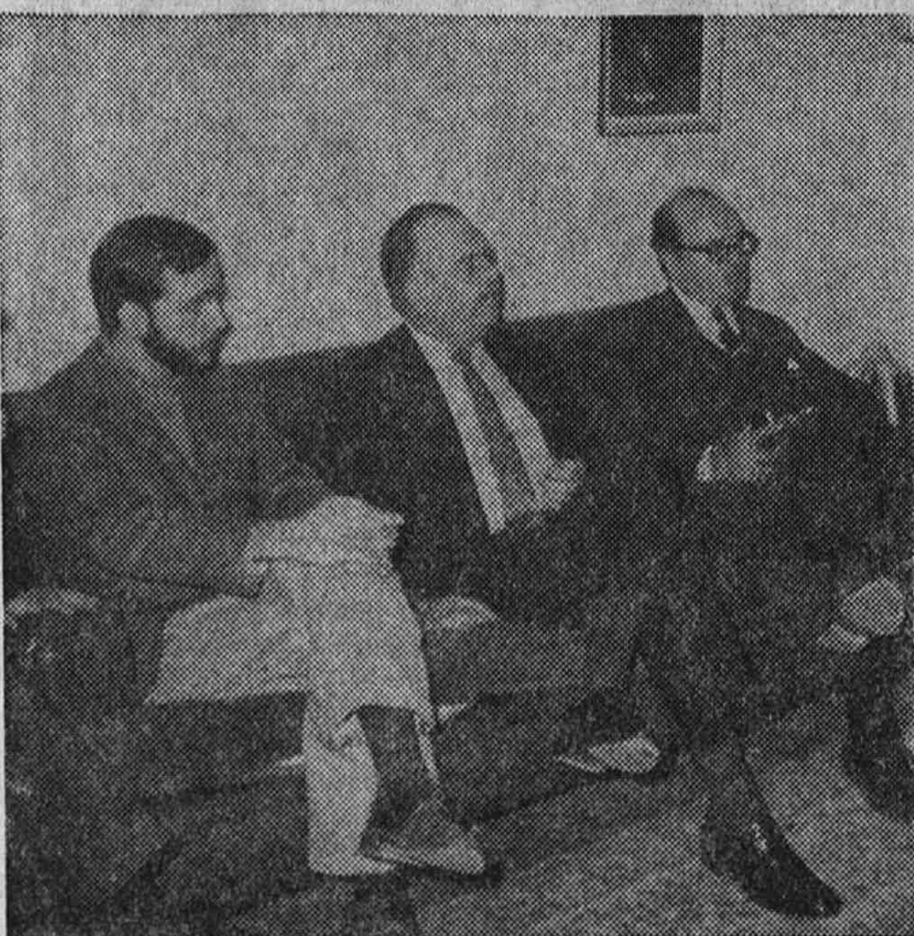
Juan Mari Bras, líder del Movimiento Pro Independencia de Puerto Rico (MPI), estuvo en Madrid en diciembre de 1969. Entonces celebró una conferencia de Prensa, recogida en esta fotografía. Mari Bras aparece en el centro, rodeado de periodistas españoles.

se aplazó la decisión «sine die» y, según Juan Mari Bras, un camino para desmenujar el caso es una acción del pleno de la Asamblea general.