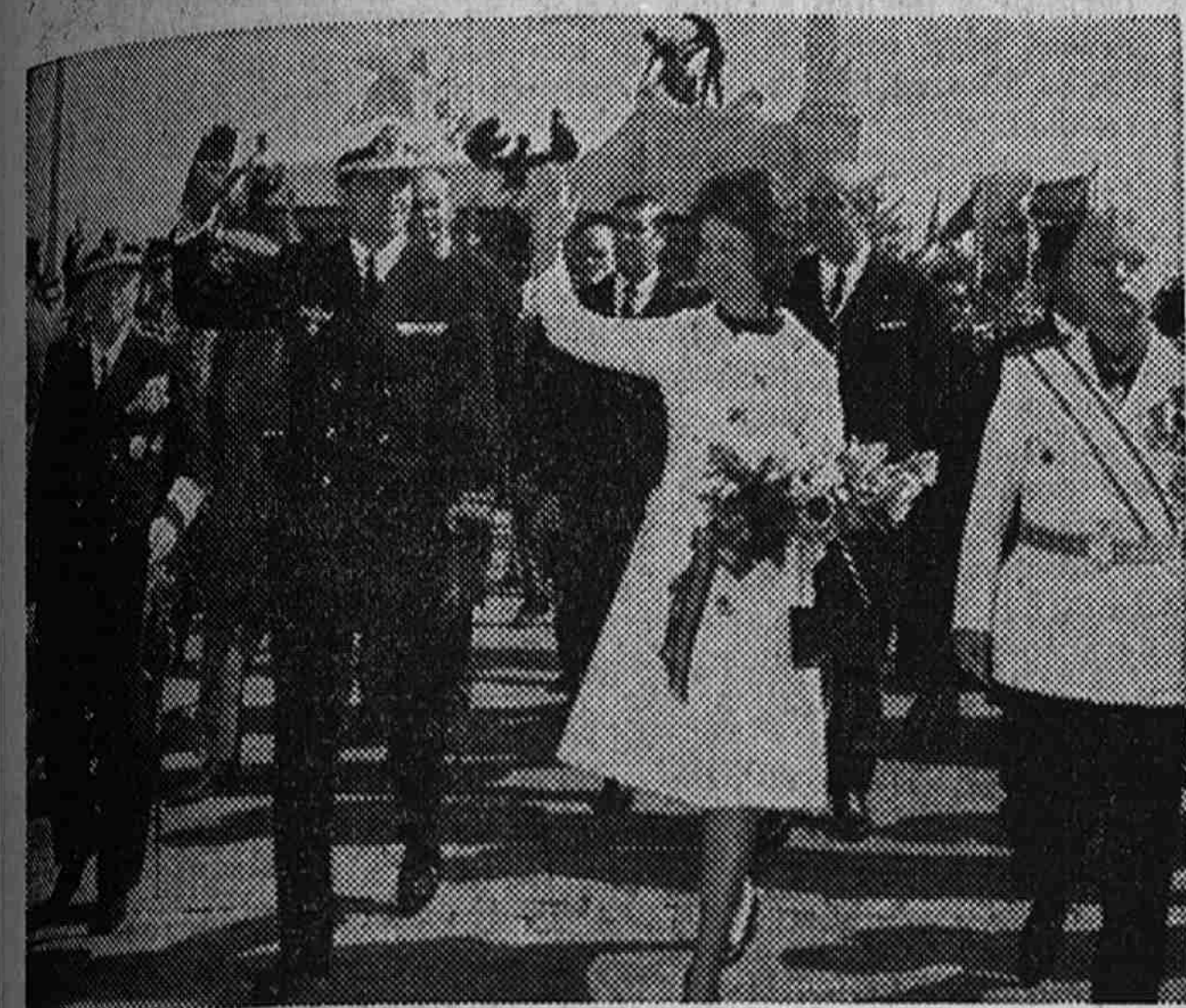
● Los Príncipes de España corresponden a los saludos del público estacionado para recibirlos en su recorrido a pie desde el muelle gaditano hasta el Ayuntamiento.

★ Juan Carlos presidió una sesión extraordinaria del Ayuntamiento gaditano ★ Sus Altezas visitaron los astilleros y la Escuela de Formación Profesional