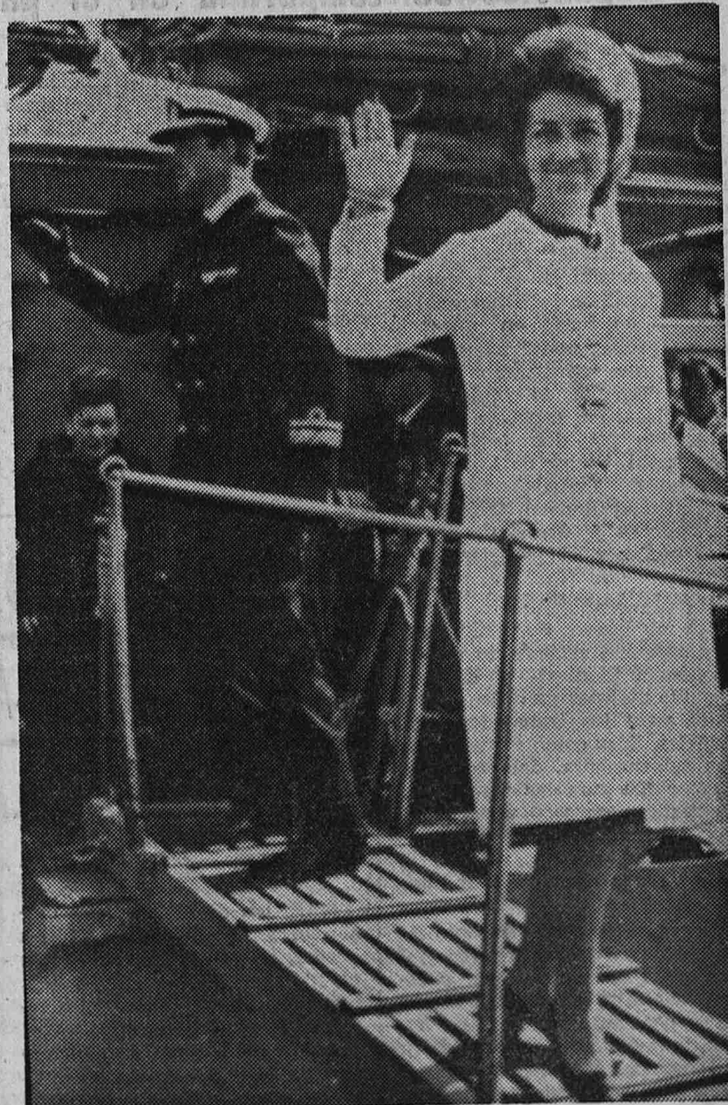
● Sus Altezas Reales descienden al muelle gaditano por la pasarela del minador «Marte». La Princesa Sofía saluda a la multitud, que les recibió cariñosamente