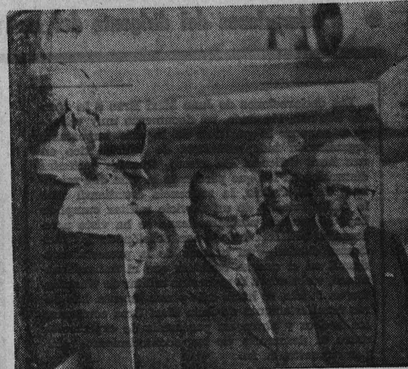
● Los Presidentes Tito, de Yugoslavia, y Saragat, de Italia, a la llegada del primero al aeropuerto de Roma en visita oficial.