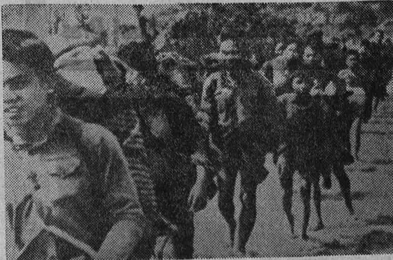
◆ Portando los pobres objetos de su propiedad, estos miembros de las tribus montañosas de Laos cruzan la frontera y pasan a territorio survietnamita. Tuvieron que dejar sus casas ante la presión de las tropas comunistas.

WASHINGTON, 25.—Desde ahora hasta el año próximo, los Estados Unidos podrán ver el fin de la guerra de Vietnam y el comienzo de una nueva era de paz y de una prosperidad