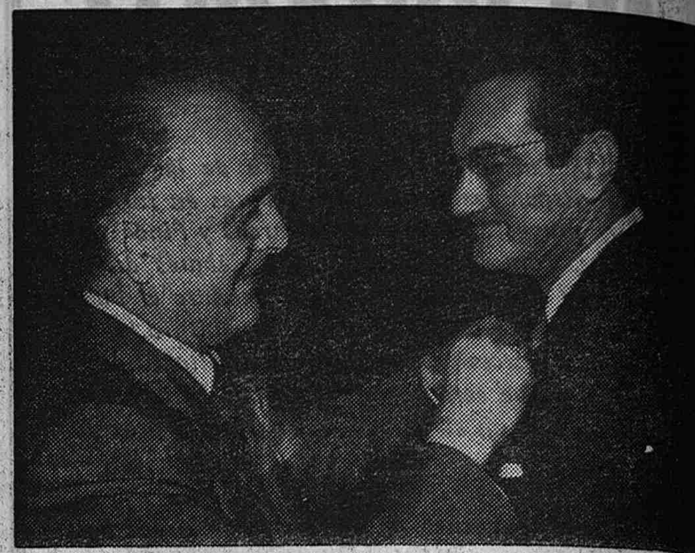
El Ministro de Trabajo, don Licinio de la Fuente, impone la medalla de oro al Mérito en el Trabajo al Ministro de Relaciones Sindicales, don Enrique García-Ramal.

«La trayectoria vital de Enrique García-Ramal es significativa de los hombres de su generación. Esa generación que se encontró una Patria alicaída, rota, dramáticamente convulsionada en lucha consigo misma y con sus viejas contradicciones internas, y a la que encendió, primero con su ilusión, fecundó luego con su sangre, levantó después con su trabajo y está sosteniendo ahora con sus experiencias y ha servido siempre con su lealtad. Y la trayectoria de García-Ra-