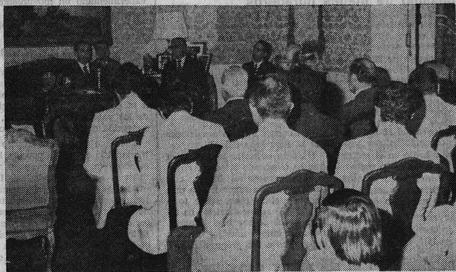
• El ministro portugués de Negocios Extranjeros, doctor Rui Patricio, en el transcurso de la rueda de Prensa mantenida con los informadores.

Despidieron al ministro portugués el señor López Bravo, Ministro español de Asuntos Exteriores; el Subsecretario del Departamento, señor Fernández Valderrama, y los embajadores de España en Portugal y de Portugal en Madrid, así como diversas personalidades.