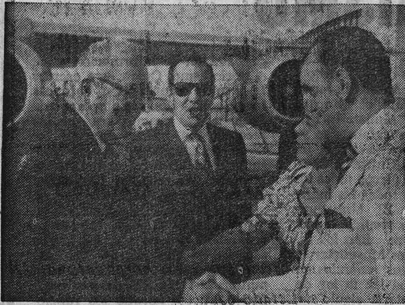
El Presidente de Panamá, señor Lakas, a su paso por el aeropuerto de Barajas. En el aeropuerto madrileño fue recibido por personal de su representación diplomática en Madrid y por representantes del Ministerio español de Asuntos Exteriores.