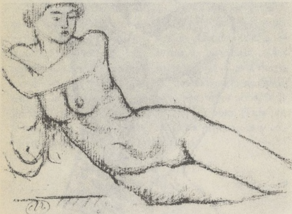
Del libro LE NU FÉMININ DANS L'ÉCOLE DE PARIS. Autor del dibujo: Aristide Maillol.