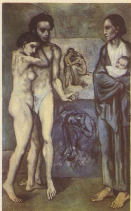
PICASSO: La Vida (Cleveland, Museo de Arte)

La sexualidad es un tema de rabiosa vigencia, en cuya difusión existen incontrolados intereses. Se hacía necesaria, en lengua castellana, una colección que tratara de la relación hombre-mujer, la psicología de los sexos, los aspectos socioculturales, su historia, bajo la autoridad de unos especialistas que aunaran su rigor científico con una forma de comunicación amplia. Bajo la dirección del profesor Juan José López Ibor, acuden a esta colección más solventes especialistas para tratar los más comunes y naturales temas sexuales.