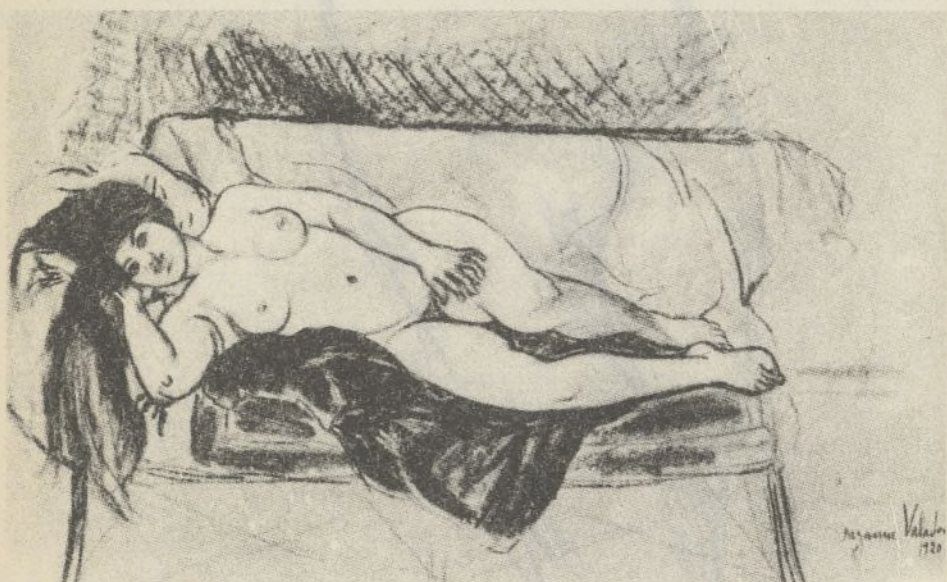
Del libro LE NU FÉMININ DANS L'ÉCOLE DE PARIS. Autor del dibujo: Suzanne Valadon.