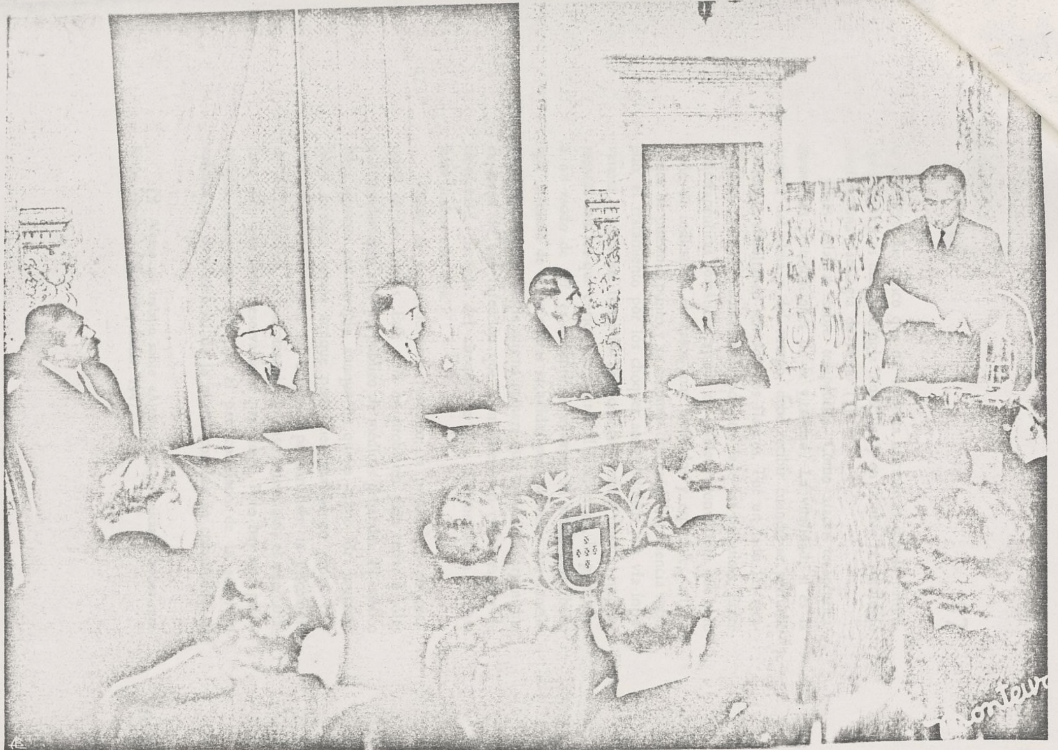
Conferência do Prof. LOPEZ IBOR Ayuntamiento de Madrid