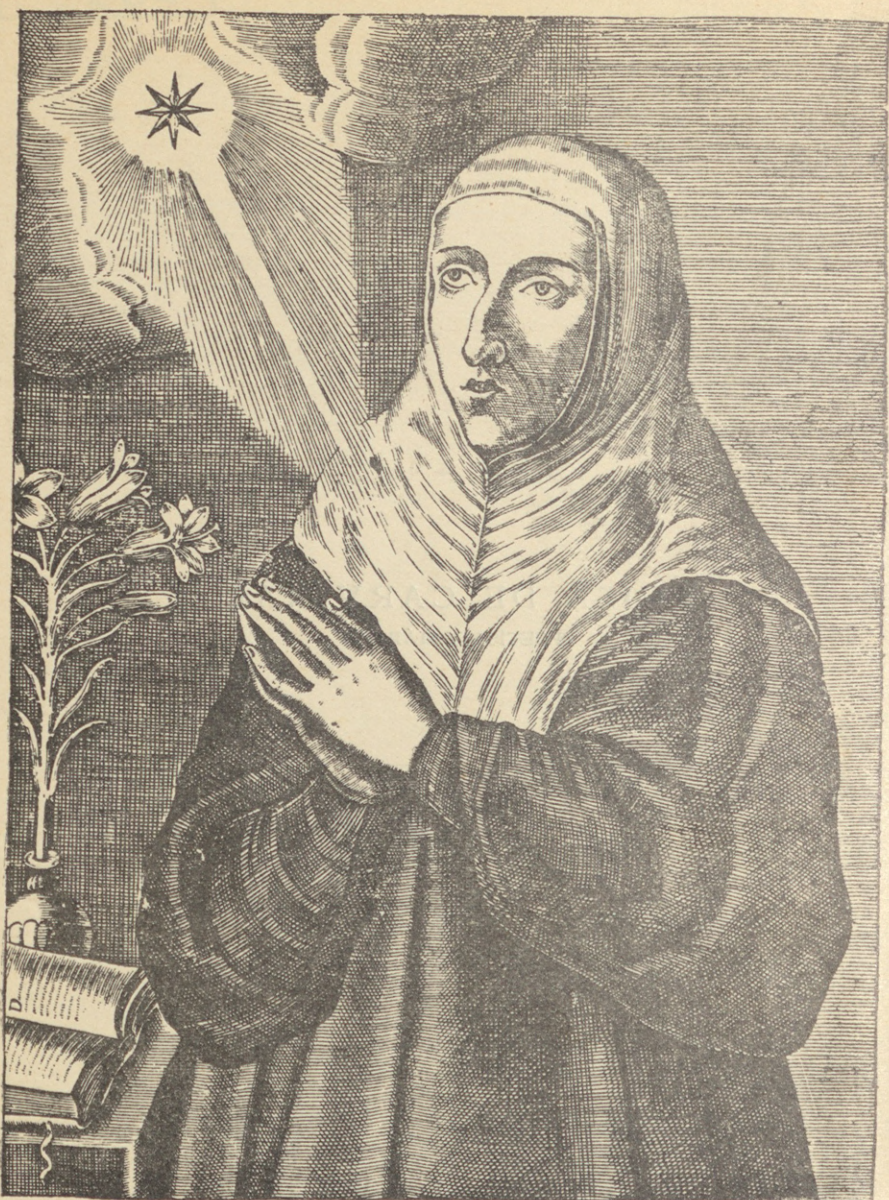
La Venerable Virgen D. Lúcia de Carvajal y Mendoza Ilustre en Santidad y Nobleza: rara en todas las virtudes: vnica en el zelo de la Religion Catolica: murio en Inglaterra a 2. de Enero de 1614. Años a los 47. de su edad. Venerase su cuerpo en el relicario del Real conuento de la Encarnacion.—(I. de Courbes: F.)