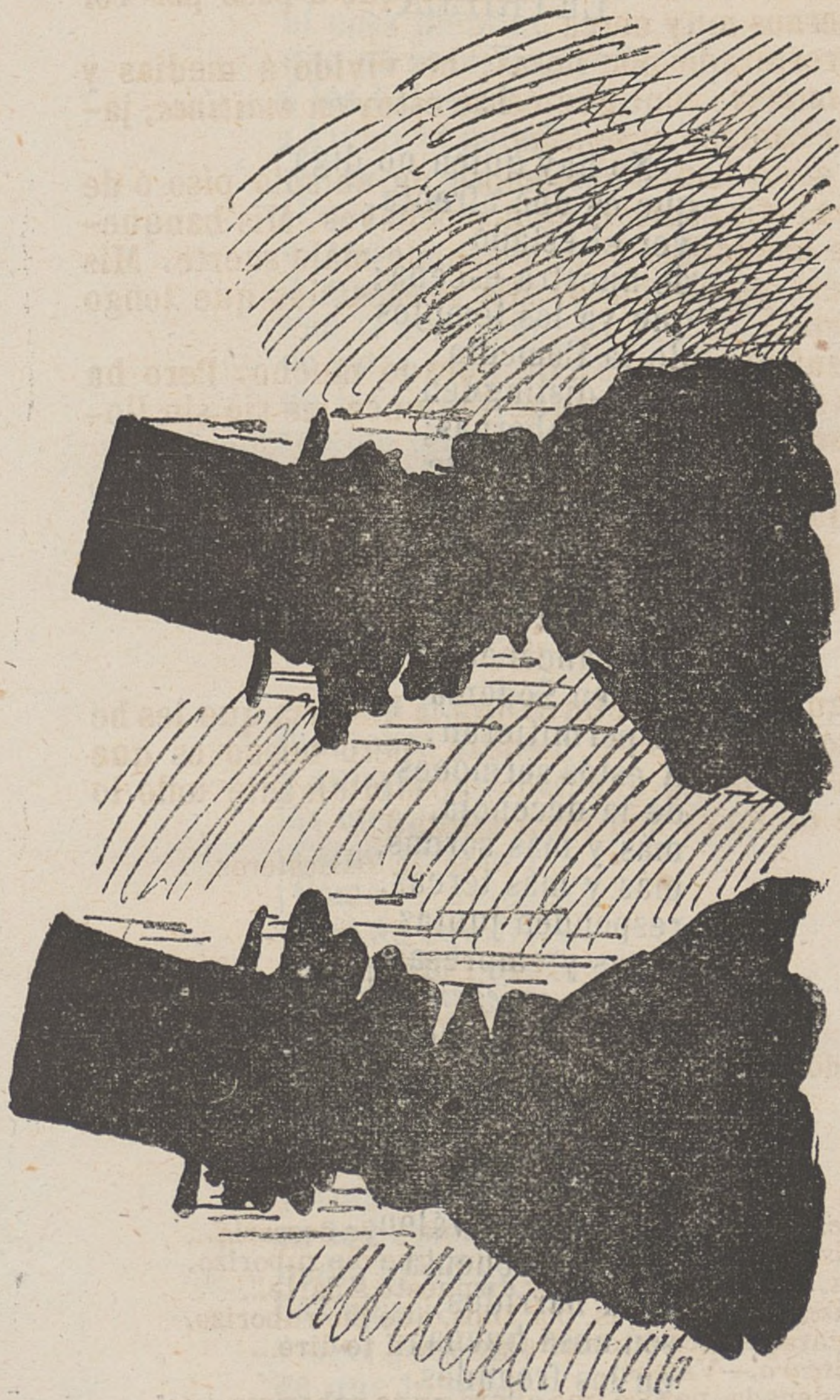
DELICIAS VERANIEGAS EN MADRID. — Dos vecinos honrados sudando tinta.