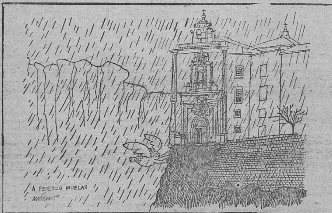
"LOS PAULES" (CUENCA)

El nuevo canceller designado en Austria es también, desde el Congreso de Klagenfurth, en septiembre último, jefe del Osterreichischer Volkspartei o partido populista. Después de ser jefe local de este partido, en Hallein y gobernador de la provincia de Salzburgo, fue designado ministro de Finanzas. Dimitió el cargo en marzo de 1963, por estimar que el canceller Gorbach hacía excesivas concesiones a los socialistas, aliados en el Gobierno de coalición. Desde entonces, y como jefe del sector más joven y dinámico de los populistas, que deseaban una política de firmeza frente a los socialistas, entabló una lucha contra Gorbach, de la que resultó vencedor. Josef Klaus es abogado y está especializado en problemas de la juventud.