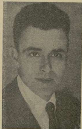
Nuestro camarada José Díaz, secretario general del P. Comunista de España (S. E. I. C.) y candidato electo a diputado por Madrid (Capital). Rot-Front, camarada Díaz.