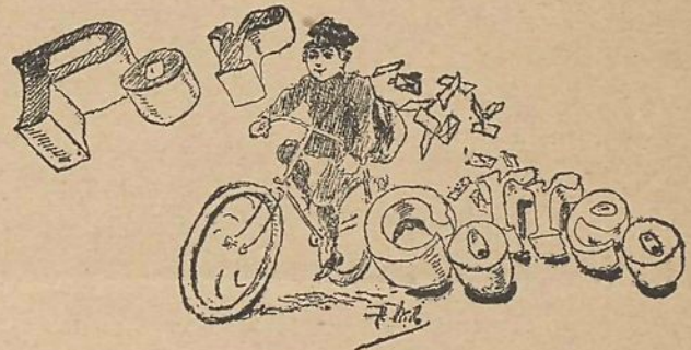
Palma de Mallorca 7 de Febrero de 1899.

Del 1.º al 6.—Niza. «Club Nautique» y «Club de la Voile» reunidas. 12, 13, 15 y 16.—Génova. «R. Y. C. Italiano».