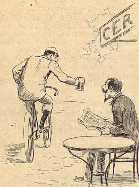
Un convidado caído del cielo

La dependencia, á más del conserje, son dos chicos ayudantes y un mecánico, que por cierto han estado estos días completamente á la disposición de todos los que hemos tenido necesidad de sus servicios, pues la Junta había dado, con una galantería imposible de describir, las órdenes necesarias para que todo forastero encontrara en el Club cuanto necesitase para hacer cualquier reparación en su máquina.