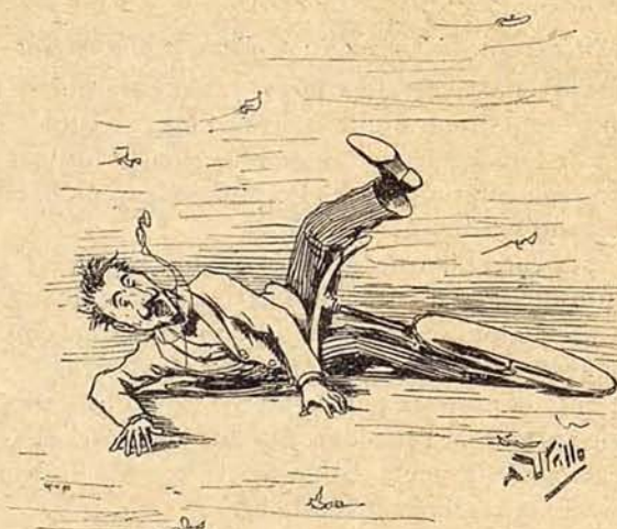
Una pequeña patinadura y un gran batacazo

El local está situado entre las calles de Mallorca y Valencia y llevará por nombre Pista Condal . Constará