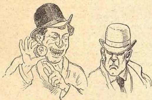
El sabio y el perdidoso

a ciclista, devuelve pelotas inverosímiles y salva tantos completamente dominados por sus contrarios, ganándose merecidas ovaciones, y después de estar 42 por 45 rojos, éstos se apuntan seguidos los cinco restantes tantos que les faltaban para conseguir la victoria.