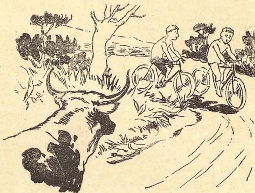
Ciclero y ciclista. — Núm. 1

Constituído el Jurado, comenzaron las pruebas por la Primera carrera .—600 metros (cuatro vueltas). Premios: 100 y 75 pesetas.