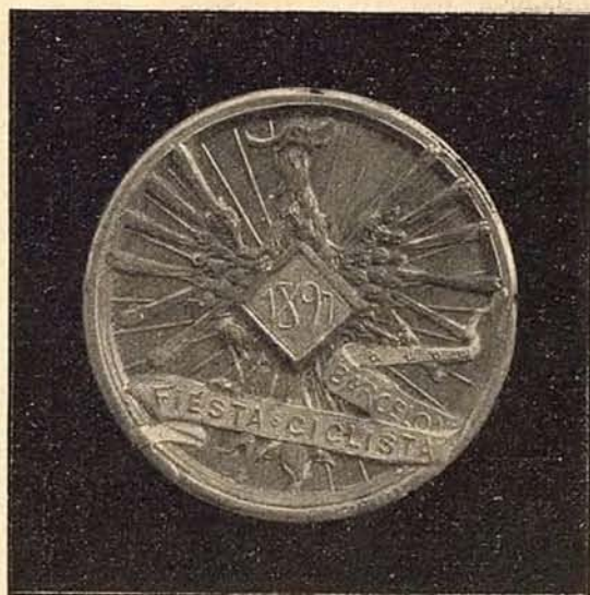
Medalla de la Fiesta Ciclista celebrada en el Parque, usada como distintivo por los comisarios y jueces

— Ve usted en la cancha á seis señoritas armadas de cesto, con pelotas finas de Sainz, ó quién sea, jugando partidas, que son, no un remedo, parodia malísima