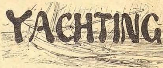
El yacht «Priny»

El regreso á ésta verificóse por Mataró, donde varios compañeros de pedal obsequiaron á los expedicionarios con un espléndido lunch.