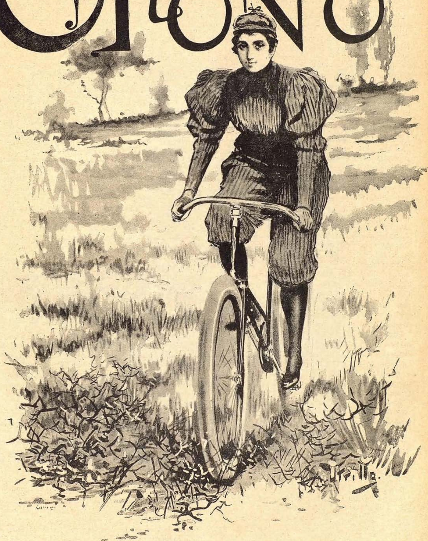
ALEGORÍA Ayuntamiento de Madrid