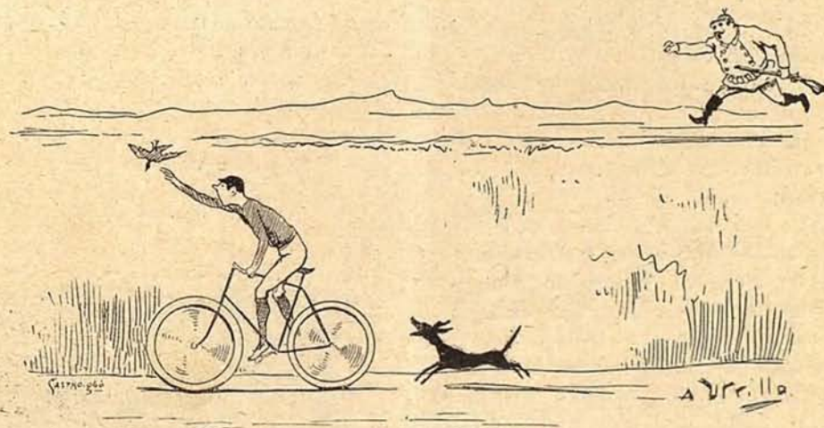
4. Y como el perro se quedó atrasado el ciclista la pieza se ha cobrado.

Una sociedad náutica importante del litoral se emancipa. «L'Union des yachtsmen de Cannes», encontrándose estrecha en su local actual de tierra firme, ha pedido á M. Abel Lemarchand un house-boat , al que transportará su domicilio social para la saison próxima.