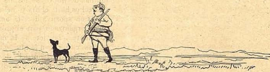
1. Don Eleuterio ha salido á caza y busca á cualquier pieza meter baza.