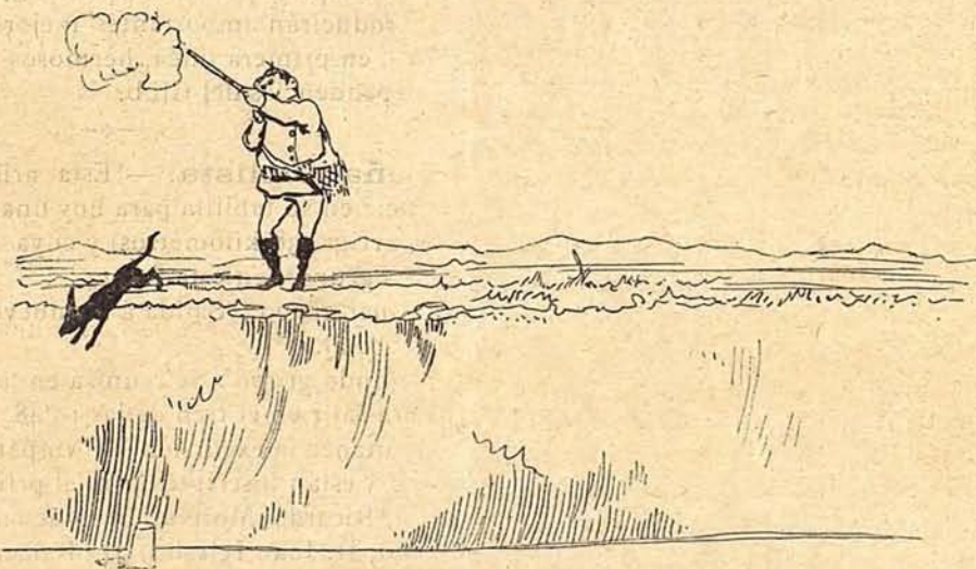
2. Por fin da gusto al dedo, tira, hiere; pero la pieza huye y no se muere.